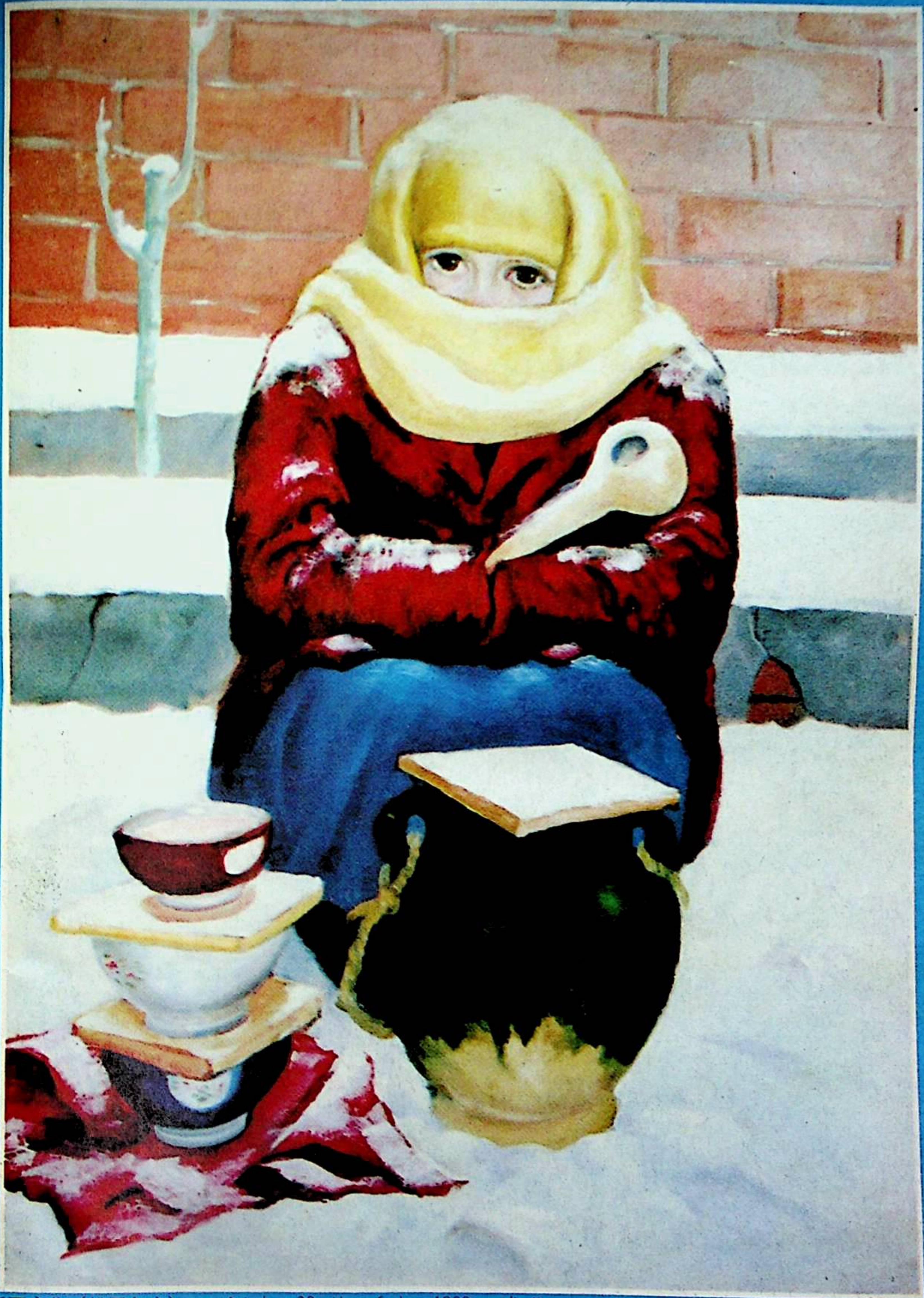
«شىنجاڭ مەدەنىيىتى» (قوش ئايلىق ئونئۇپرسال ئەدەبىي ژۇرنال) 1989 - يىلى 6 - سان، 38 - يىلى نەشرى 新疆文化 (维吾尔文)

«شىنجاڭ مەدەنىيىتى» ژۇرنىلى تەھرىر بۆلۈمى تۈزدى. تېلېفون نومۇرى: 28055. شىنجاڭ تويغۇر ئاپتونوم رايونلۇق ئاممىۋى سەنئەت بۆرتى نەشر قىلدى. «شىنجاڭ گېزىتى» باسما زاۋۇتىدا بېسىلدى. ئۈرۈمچى شەھەرلىك پوچتا ئىدارىسى تارقىتىلدى. مەملىكەتنىڭ ھەرقايسى جايلىرىدىكى پوچتخانىلار مۇشتىرى قىلدى. تاق ئايلارنىڭ 20 - كۈنى نەشرىدىن چىقىلدى.