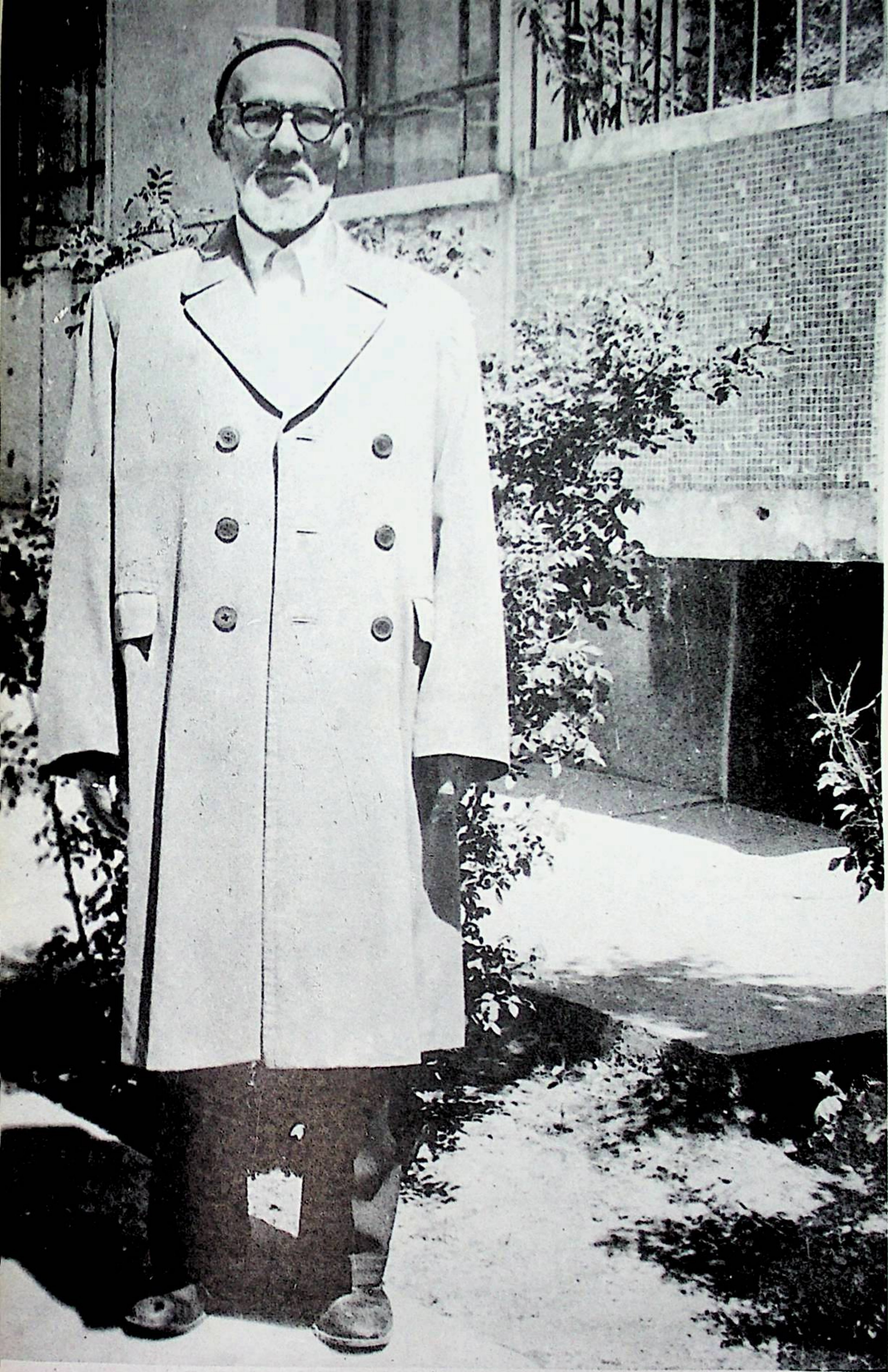
ٲه دب؁ ٲالم ٲه همه دزيائي (1913)