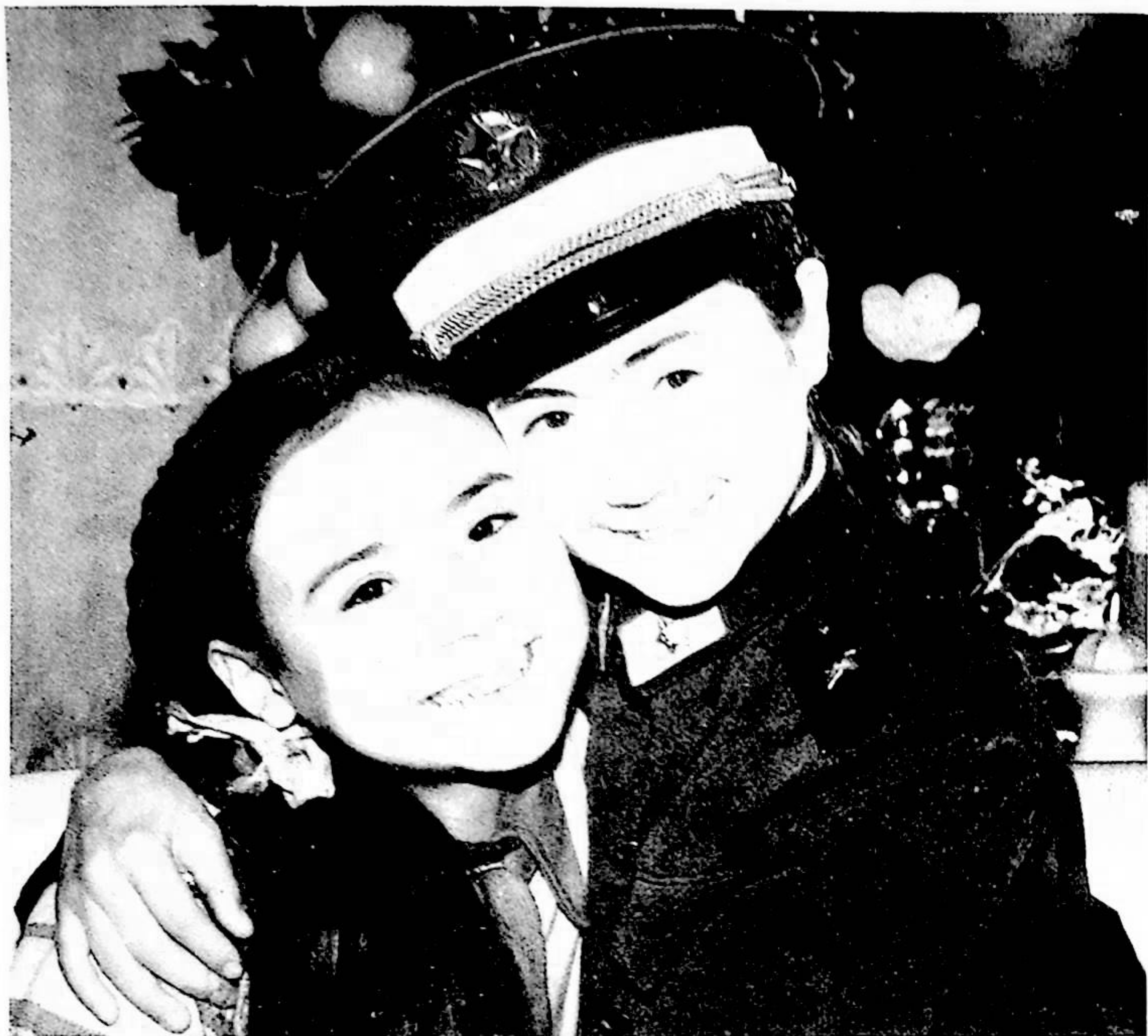
خۇرشىدە غوپۇر فوتوسى