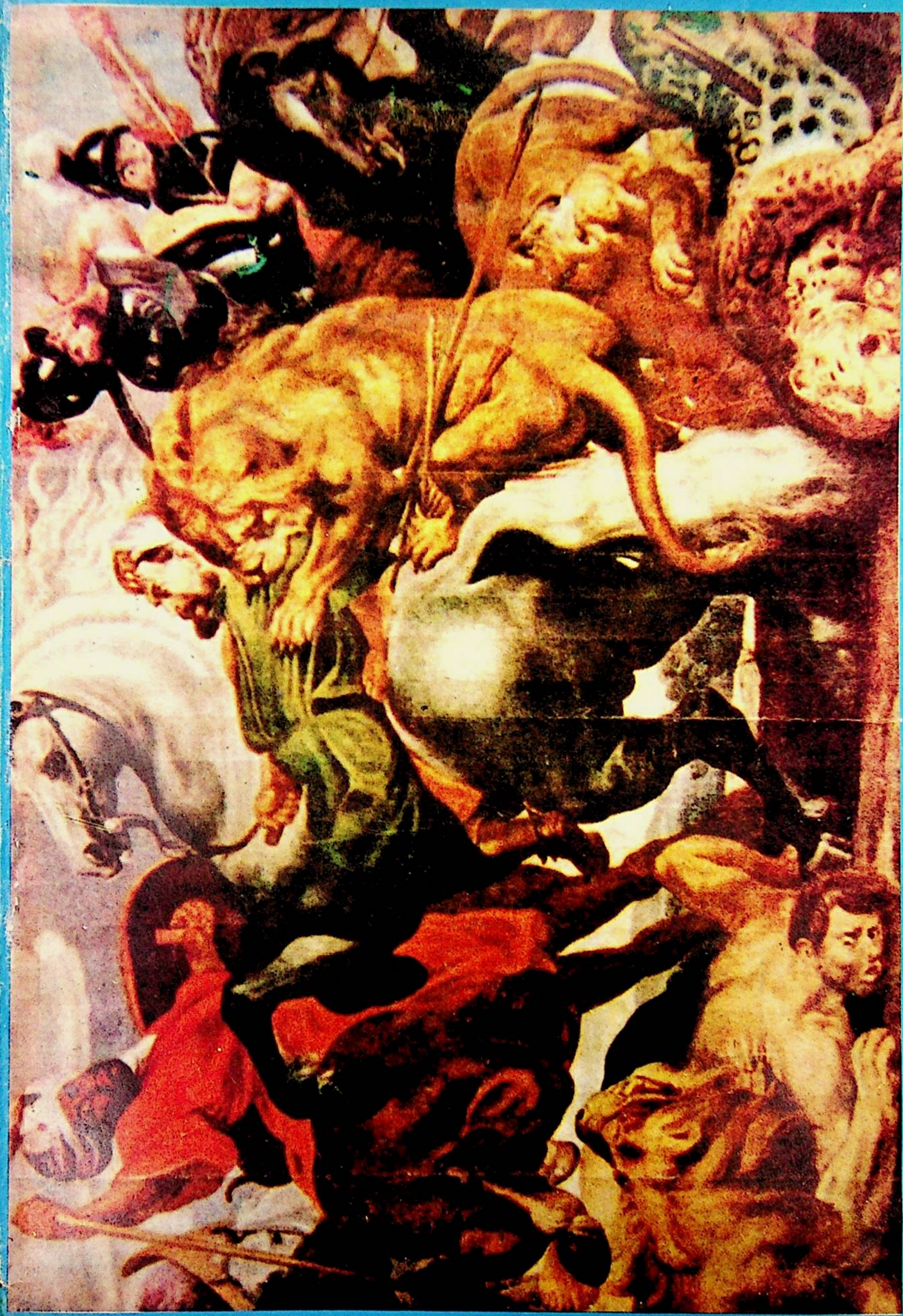
شیر ئوۋلاش. روبنس (1640 — 1577) سزغان.