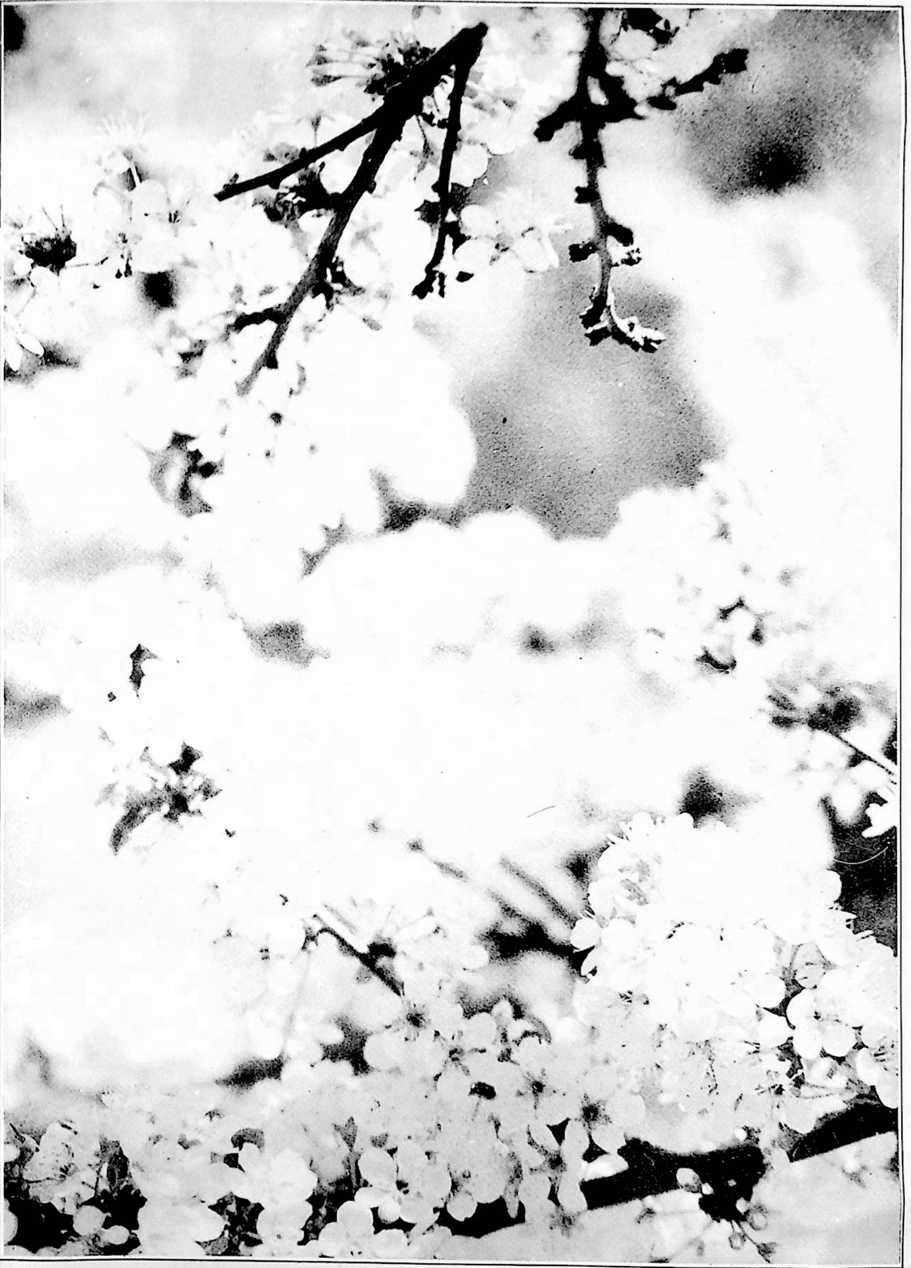
ياك جچىك فوتوسى