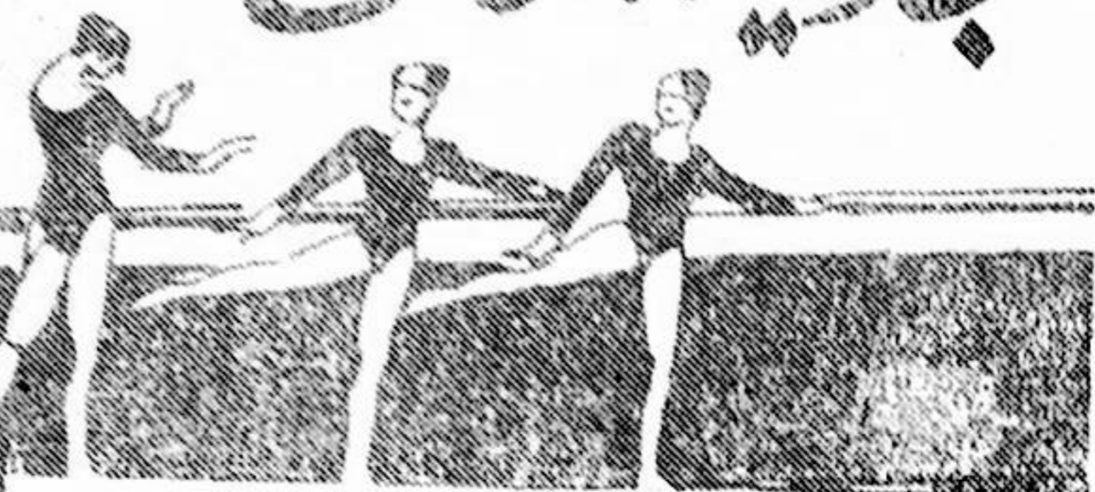
ئە نۇەر توختى

ئۇسسۇل - ئادەم بەدىنىنىڭ رېتىملىق، تال- لاپ ئېلىنغان ۋە قۇراشتۇرۇلغان ھەرىكەتلىرى، قىياپىتى، مەنىۋى ئىپادىلىرىنى ۋاسىتە قىلىپ تۇرۇپ، تاماشىبىنلارنىڭ كۆز ئالدىدا مۇئەييەن زاماندا (ۋاقىت ئىچىدە) ھەرىكەتلىنىپ تۇرىدىغان ھالەت ۋە مۇئەييەن ماكاندا (ئورۇندا) كۆرگىلى بولىدىغان ئوبراز بىلەن ئەكس ئەتىپ، پىكىر ۋە ھېسسىياتنى ئىپادىلەپ بېرىدىغان سەنئەتتۇر.