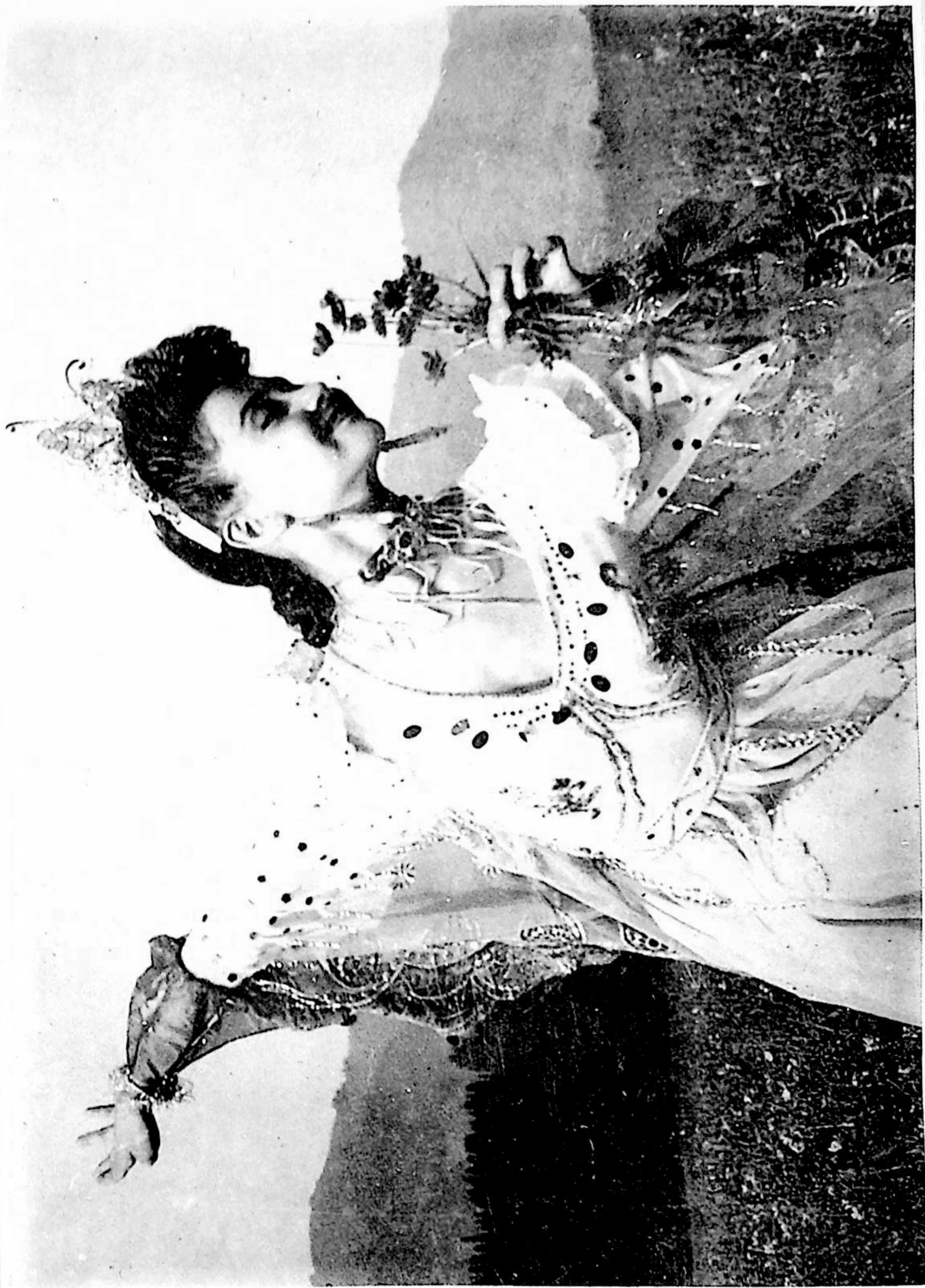
كېپنەك ئۆسسۈلى رۈستەم ئالىز فوتوسى