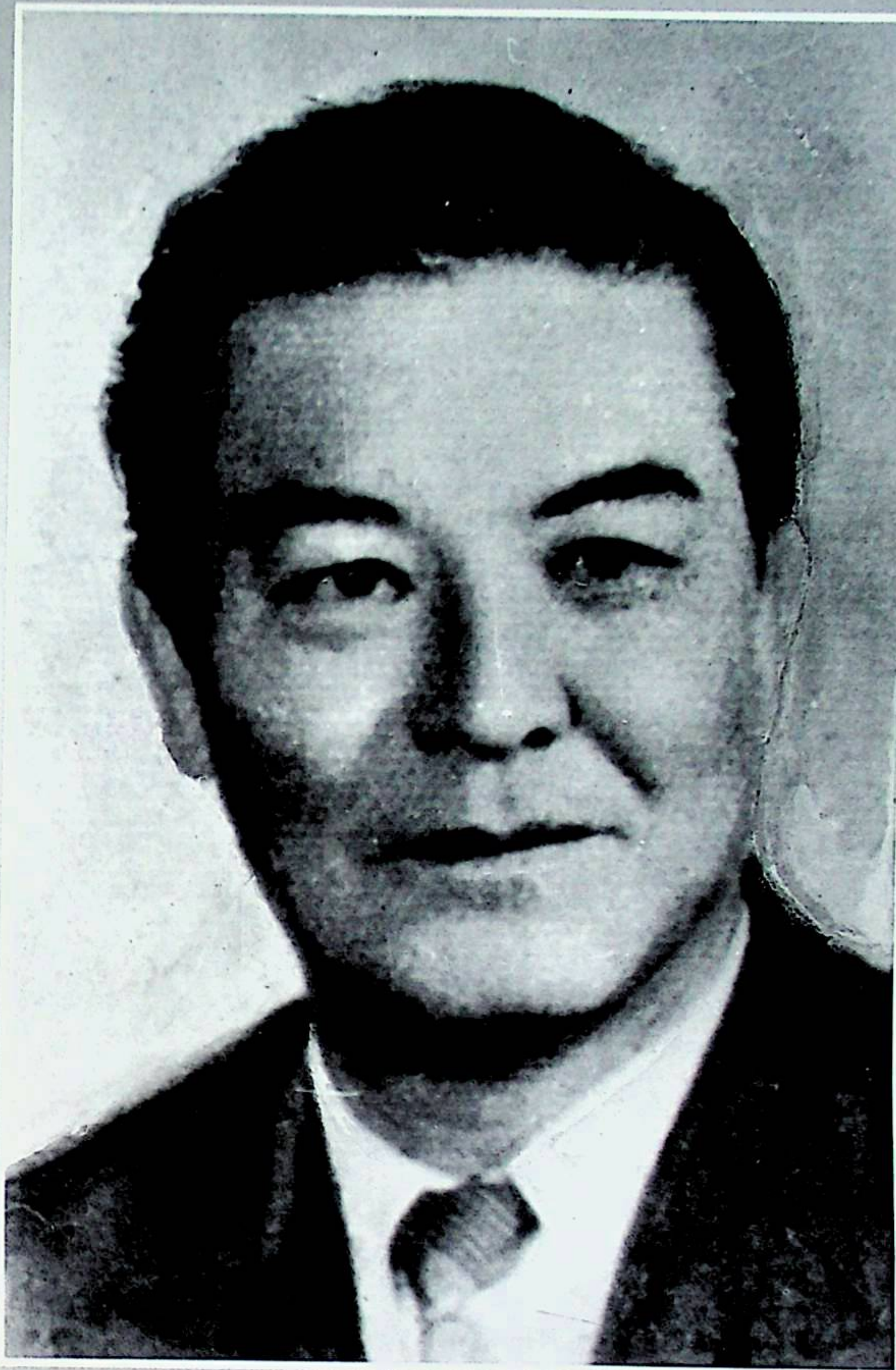
مەشھۇر ئالىم، ئەدىب ئابدۇرەھىم ئۆتكۈر. (1923 - 1995.10.5)