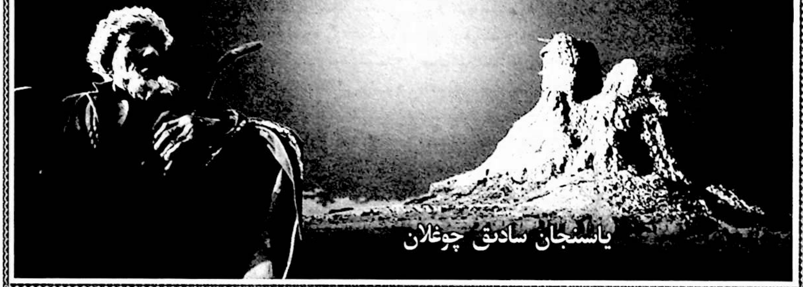
ياسىنجان سادىق چوغلان