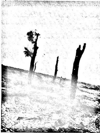
چۆلدىكى ھاياتلىق لۇ ۋاڭخاۋ فوتوسى

ھەر ئاينىڭ 5 - كۈنى نەشىردىن چىقىدۇ جايلاردىكى پوچتىخانىلار مۇشتەرى قوبۇل قىلىدۇ ئۈرۈمچى شەھەرلىك پوچتا ئىدارىسى تارقىتىدۇ