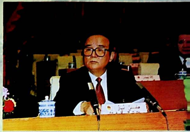
مۇدىر ھامىدىن نىياز يىغىنىنىڭ سايلام خىزمىتىگە رىياسەتچىلىك قىلدى