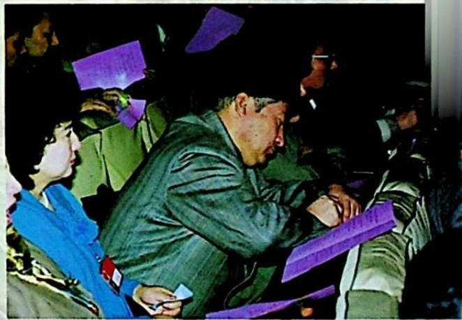
ۋەكىللەر سايلام بېلىتىنى ئەستايىدىل تولدۇردى

ئاپتونوم رايونلۇق 9 - نۆۋەتلىك خەلق قۇرۇلتىيىنىڭ 2 - يىغىنى ئاياغلاشقاندىن كېيىن، ئاپتونوم رايونلۇق خەلق دائىمىي كومىتېتى پۈتۈن شىنجاڭ بويىچە خەلق قۇرۇلتىيى خىزمىتى سۆھبەت يىغىنى ئاچتى. جايلاردىكى ئوبلاستلىق، شەھەرلىك (ناھىيىلىك) خەلق دائىمىي كومىتېتلىرى، ۋىلايەتلىك خەلق قۇرۇلتىيى خىزمىتى كومىتېتلىرىنىڭ مەسئۇللىرى يىغىنغا قاتنىشتى.