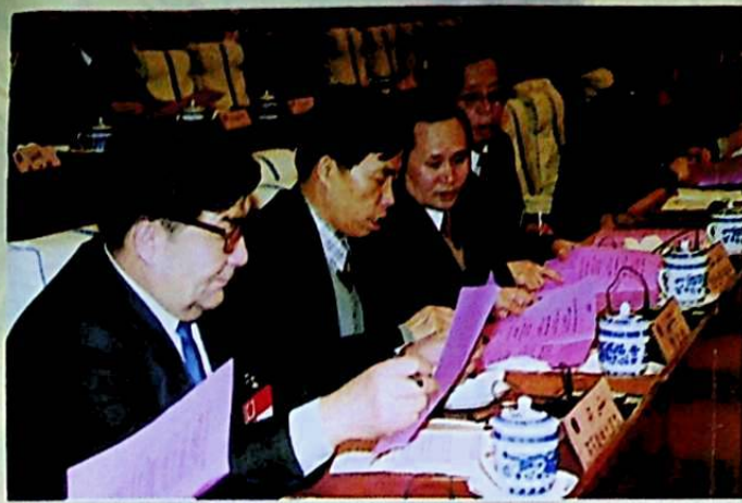
ھەيشەت رىياسىتىدىكى ۋەكىللەر سايلام بېلىتىنى ئەستايىدىل تولدۇردى