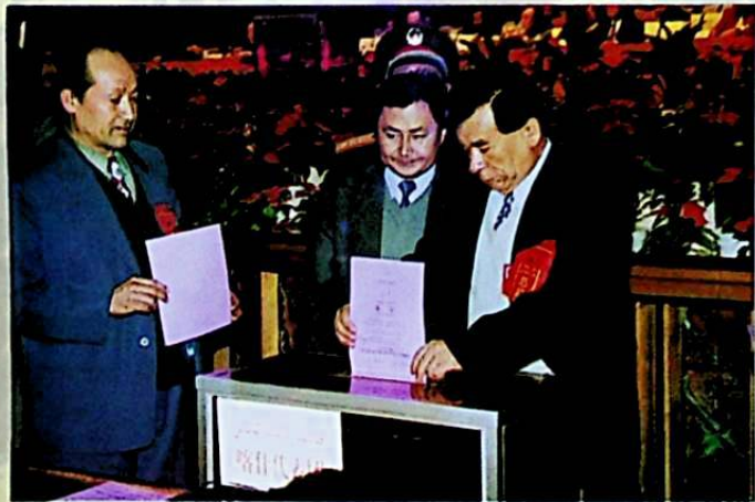
ۋەكىللەر ئاپتونوم رايونلۇق يۇقىرى خەلق سوت مەھكىمىسىنىڭ باشلىقىنى بىلەن تاشلاپ سايلدى

ئاپتونوم رايونلۇق 9 - نۆۋەتلىك خەلق قۇرۇلتىيى 2 - يىغىنىنىڭ سايلام خىزمىتىدىن