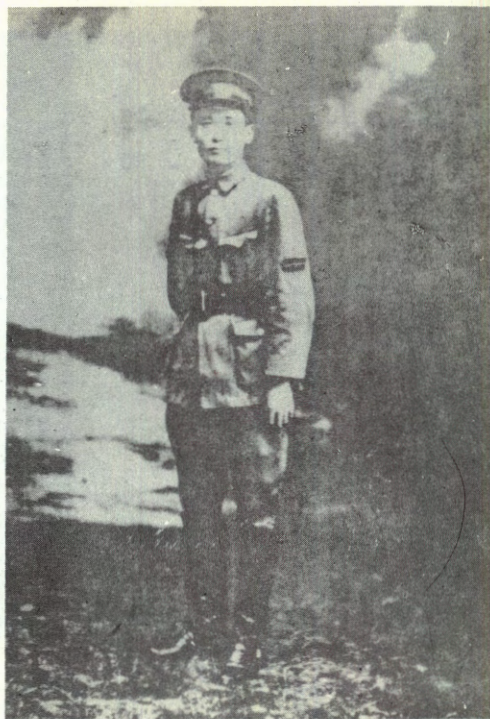
1-رەسىم: 1924-يىلى جاڭ جۇجۇڭنىڭ خۇاڭپۇ ھەربىي مەكتىپىدە مەسئۇل ۋەزىپىدە تۇرۇۋاتقان ۋاقتى.