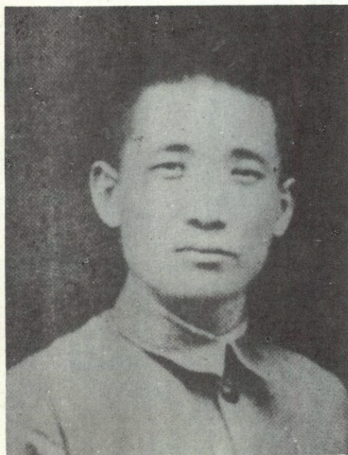
2 - رەسىم: جاڭ جۇجۇڭنىڭ 1932 - يىلى 28 - يانۋار ياپۇنغا قارشى ئۇرۇش مەزگىلىدە چۈشكەن رەسىمى.