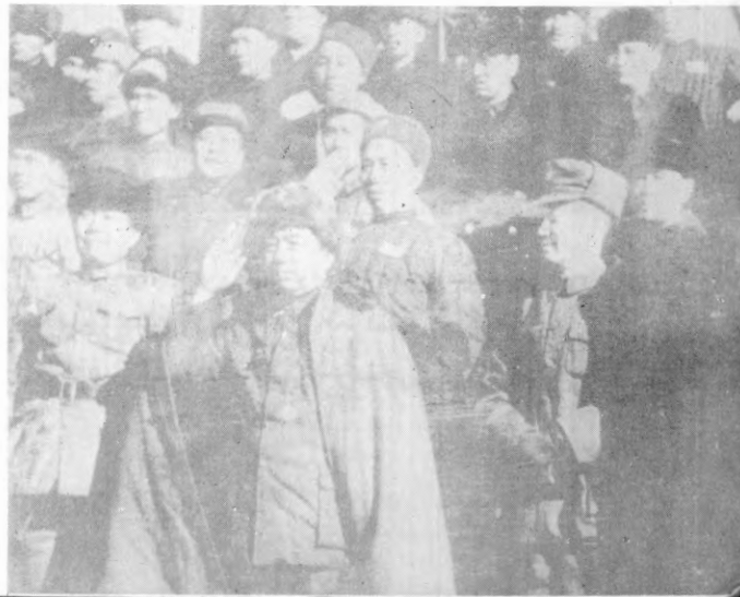
6 - رەسىم: 1949 -