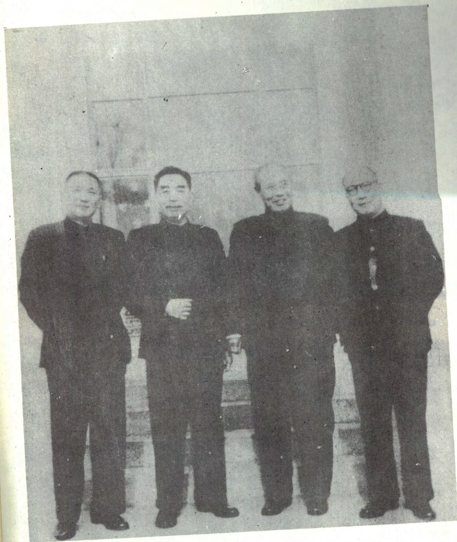
7 - رەسىم: 1962 - يىلى باھار بايرىمىدىن ئىلگىرى جۇڭخۇا خەلق جۇمھۇرىيىتى (سولدىن بىرىنچى)، فۇ زويى (سولدىن ئىككىنچى)، چو ۋۇ (ئوڭىدىن بىرىنچى) قاتارلىقلار بىللە.