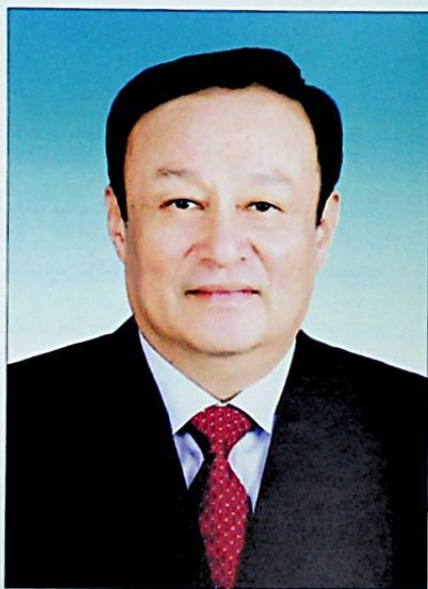
■ شۆھرەت زاكىرنىڭ ئۇيغۇر ئاپتونوم رايونىنىڭ رەئىسلىكىگە تەيىنلەنگەن ۋاقىتتا چۈشكەن ئۆلچەم- لىك سۈرىتى