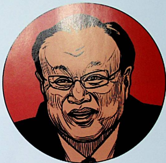
■ ئۇيغۇر ئاپتونوم رايونىنىڭ قورچاق رەئىسى شۆھرەت زاكىر