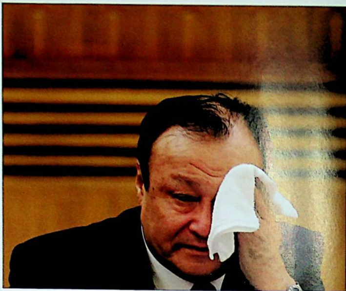
■ رەئىس سەھنىسىدە پۈتۈن ۋۇجۇدىنى قارا تەرباسقان شۆھرەت زاكىر