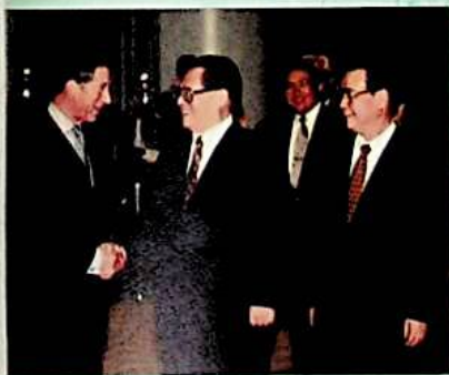
الرئيس جيانغ تسه بين ورئيس مجلس الدولة لي ينغ مع الأ تشارلز