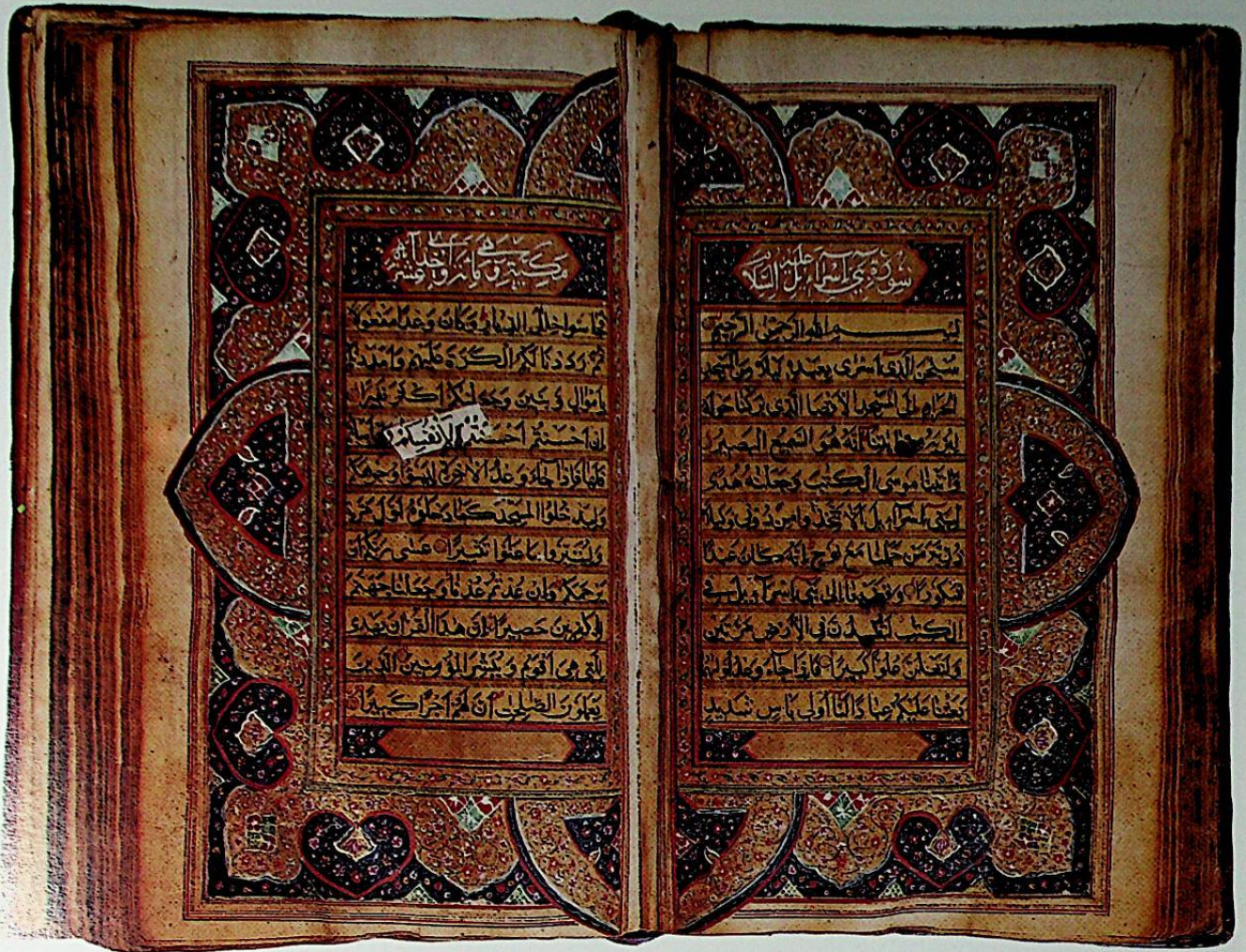
1. Koran. XVIII w., uzupełniony w XIX w.