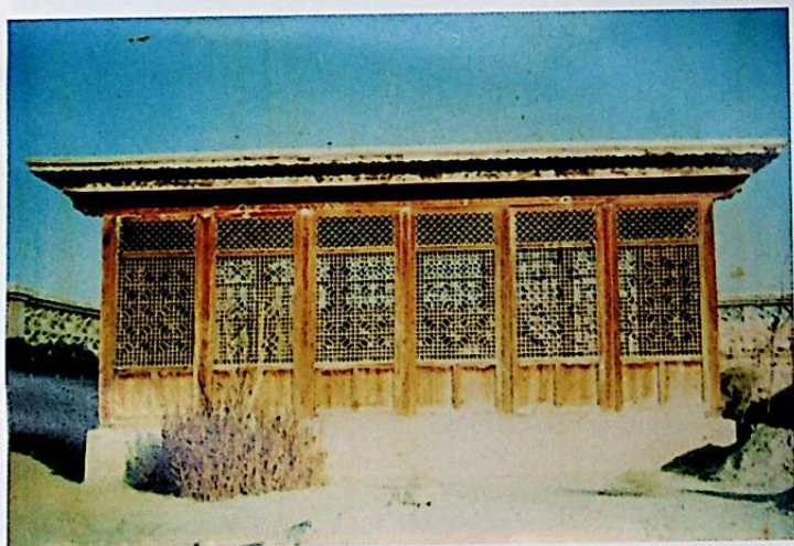
شائىرنىڭ قەبرىسى ئۈستىگە ئورنىتىلغان ياغاچ پەنجىرە