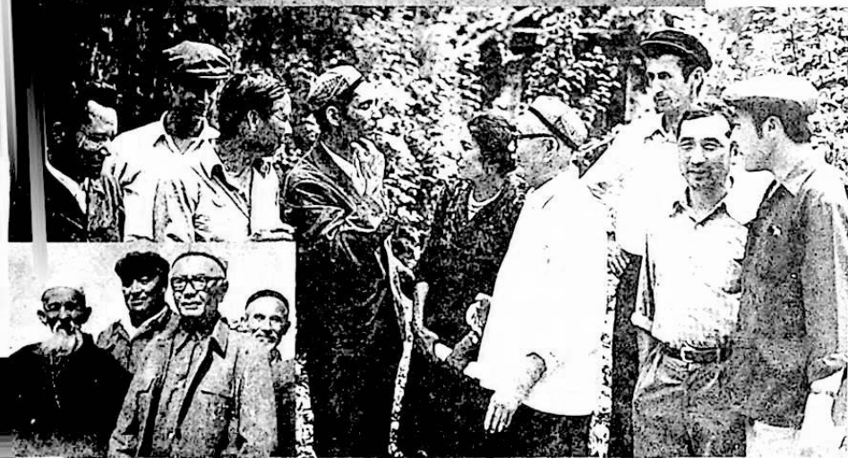
زۇنۇن قادىر ئەدىبىلەر ۋە دېھقانلار ئارىسىدا .