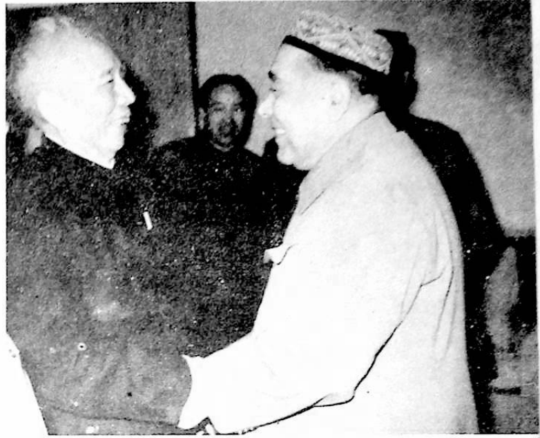
▶ بولداش ۋاڭ جىن بىلەن بىللە .