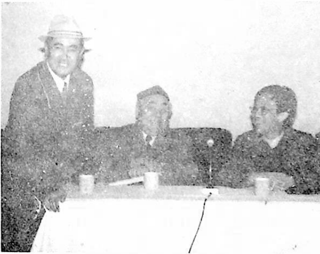
بولداش ۋاڭ مىڭ ۋە تىنچان ئېلىيۇ بىلەن بىللە .