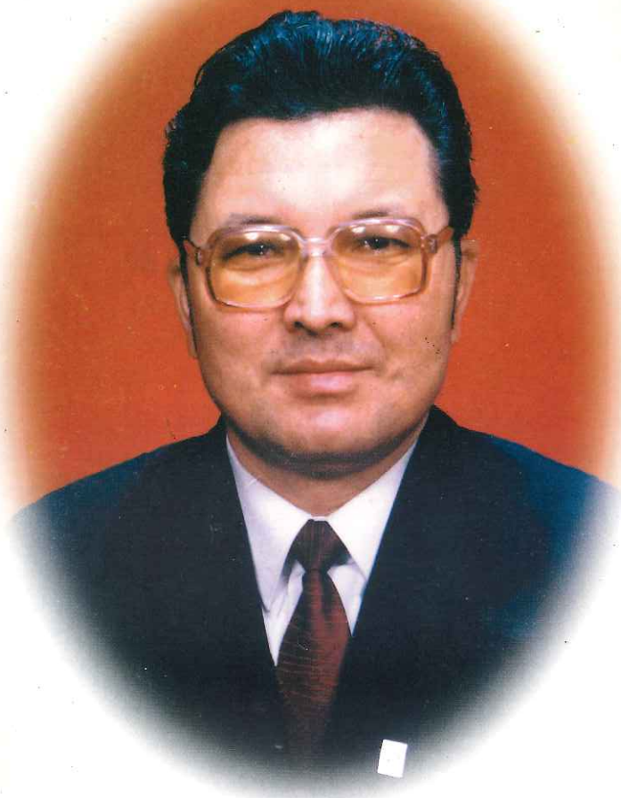
ئاپتوننىڭ يېقىنقى سۈرىتى