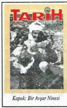
Kapak: Bir Avşar Ninesi