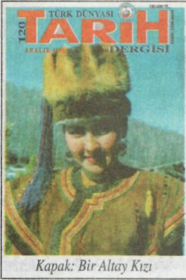
Kapak: Bir Altay Kızı