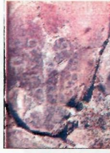
Kapak: Altay Dağlarında atalarımızın damgaları