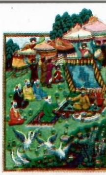
Kapak: Hoca'nın Emir Timur ile muhaveresi.