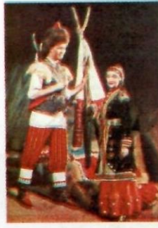
Kapak: Başkurt gençleri milli kıyafetleriyle