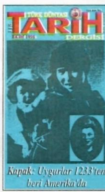
Kapak: Uygurlar 1233'ten beri Amerika'da