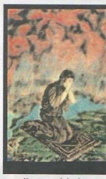
Harp esnasında basılmış bir kartpostal. (İlk kez neşredilmektedir.)