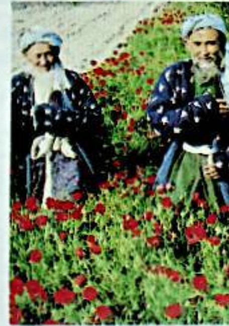
SOVYET MÜSLÜMANLARI Bütün Dünyanın Gözü Onların Üzerinde İken Türkiye'ye Biçilen Görevler ve Yapılması Gerekenler S.5