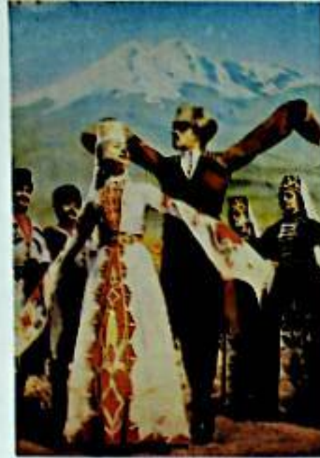
KAPAK: Kuzey Kafkasya'da Mingitav Eteklerinde Toy