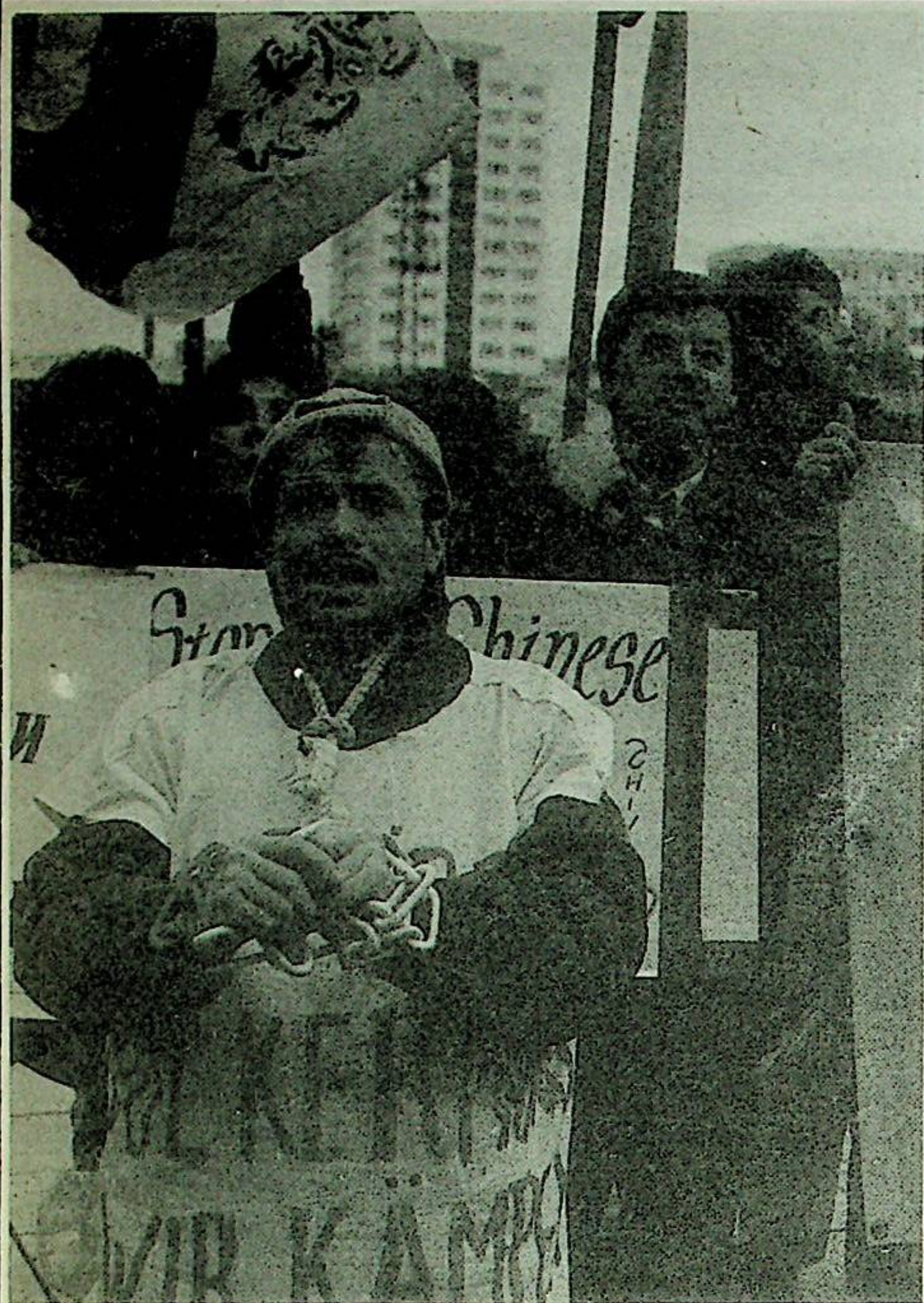
( 99 - يىلى 12 - ئاينىڭ 10 - كۈنى « دۇنيا ئىنسان ھەقلىرى كۈنى » مۇناسىۋىتى بىلەن گىرمانىيەنىڭ پايتەختى بېرلىن شەھىرىدىكى خىتاي ئەلچىخانىسىنىڭ ئالدىدا ئۇيغۇرلار تەرىپىدىن ئۆتكۈزۈلگەن نارازىلىق نامايىشىدىن بىر كۆرۈنۈش )

گوللاندىيەدە تۈرۈشلۈك ئىختىيارى مۇخبىرىمىز نىغمەت ئابدۇۋېلى خەۋەر قىلىدۇ: 99 - يىلى 11 - ئاينىڭ 15 - كۈنى گوللاندىيەدە مۇھاجىرەتتە ياشاۋاتقان بىر گۇرۇپ شەرقىي تۈركىستانلىق خىتاينىڭ گوللاندىيەدىكى باش ئەلچىخانىسىنىڭ ئالدىدا نامايىش ئۆتكۈزۈپ، كوممۇنىست خىتاي ھۆكۈمىتىنىڭ شەرقىي تۈركىستاندا يۈرگۈزۈۋاتقان قىرغىنچىلىق سىياسىتىگە ۋە شەرقىي تۈركىستان خەلقىنىڭ ئىنسانىي ھەق - ھوقۇقلىرىغا قىلىۋاتقان تاجاۋۇزچىلىق قىلمىشىغا قاتتىق نارازىلىق بىلدۈردى. نامايىشقا قاتناشقان ئۇيغۇر ياشلىرى خىتاي ھاكىمىيىتىگە قارشى تۈرلۈك مەزمونلاردىكى شونارلارنى جاراڭلىق ھالدا ئوۋلاپ، خىتاي ئەلچىخانىسىنىڭ ئالدىنى زىل - زىلگە سالدى ۋە نامايىش جەريانىدا خىتاينىڭ دۆلەت بايرىقى بىلەن جاڭ زېمىننىڭ رەسمىي كۆيدۈرۈپ تاشلىدى.