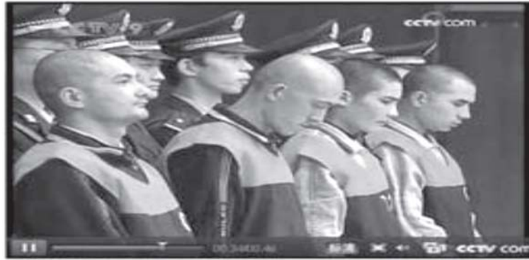
Five people received the death sentence on Thursday for murder and other crimes committed the July 5th riot in Urumqi, the capital of the Xinjiang Uyghur Autonomous Region.

Special Report: 7.5 Xinjiang Urumqi Riots I