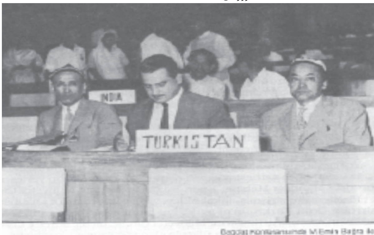
Bagdat Konferansunda M.Emir Bagra 40

مانجۇ سۇلالىسىنىڭ شەرقىي تۈركىستان ئۈستىدىكى ھۆكۈمرانلىقى 1911-يىلىغىچە داۋاملىشىدۇ. 1911-يىلى خىتايدا نەچچە ئەسىردىن بېرى ھۆكۈم سۈرۈۋاتقان مانجۇ سۇلالىسى ئاغدۇرۇپ تاشلىنىپ جۇمھۇرىيەت قۇرۇلىدۇ. جۇمھۇرىيەت مەزگىلىدە شەرقىي تۈركىستان رەسمىيەت جەھەتتىنلا خىتاينىڭ باشقۇرۇشى ئاستىدا ئىدى.