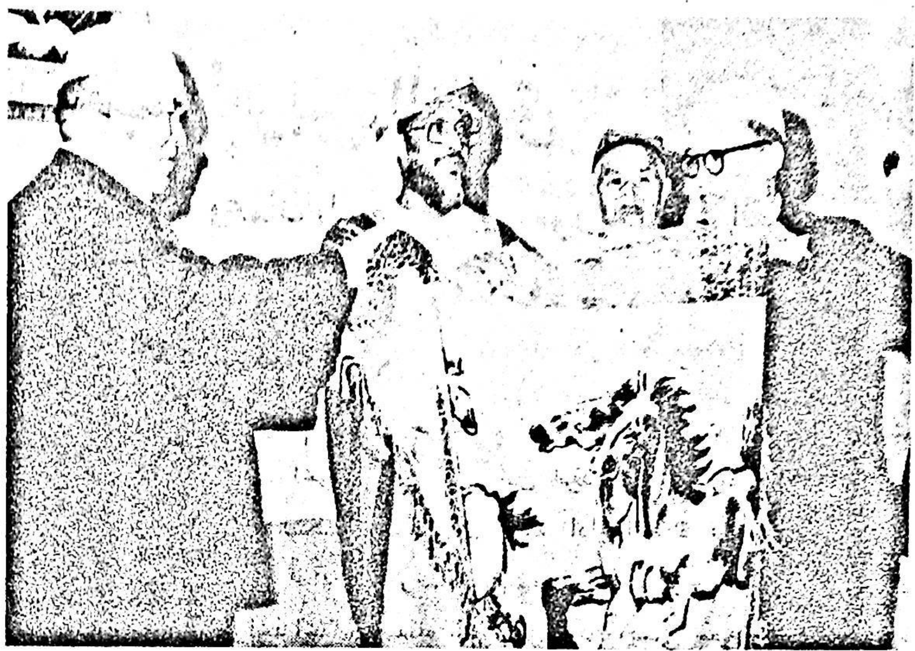
وفد المسلمين الصينيين يقدم هدية الى وزير العدل لسطنة عمان