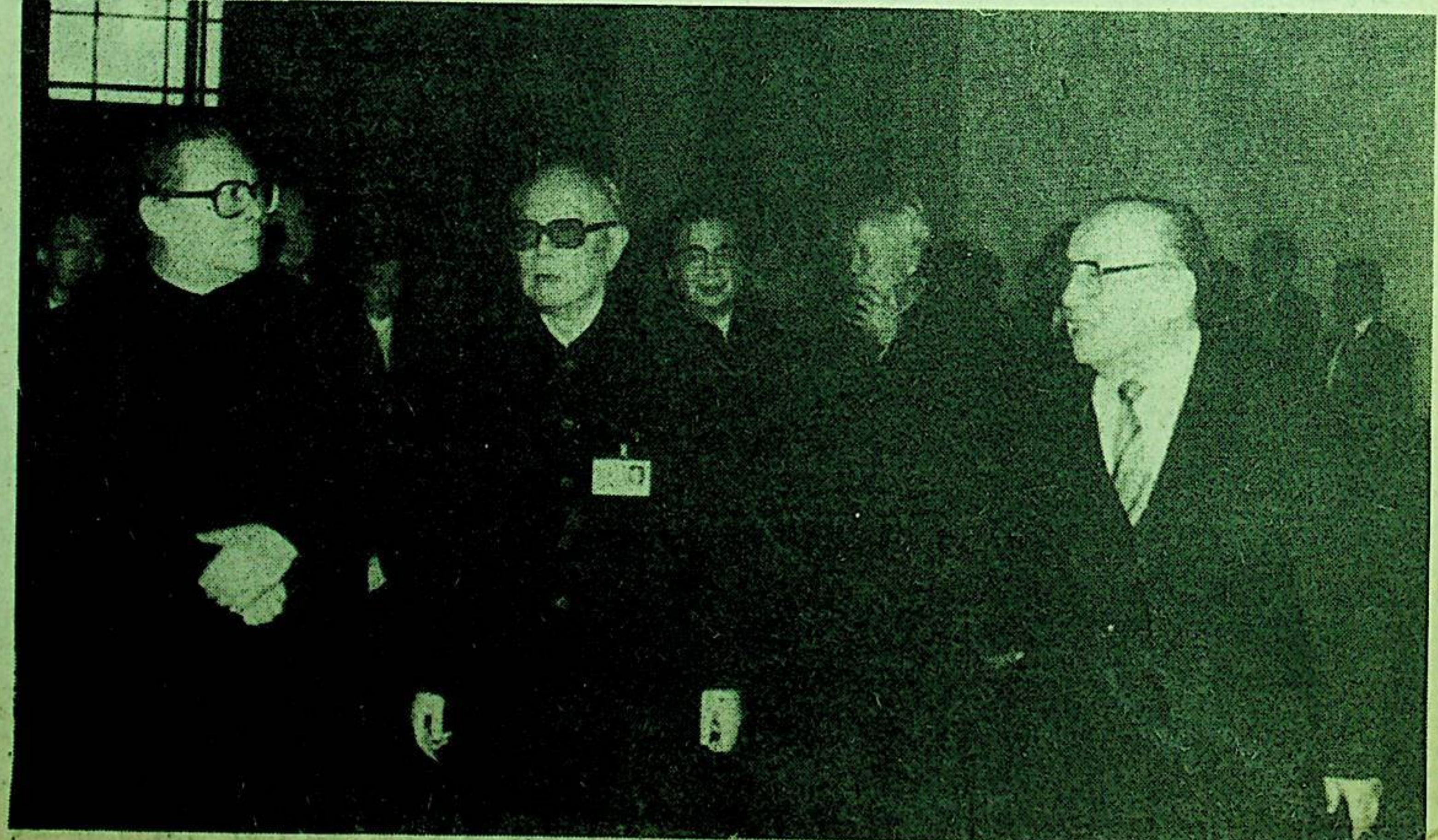
جياڭ زېمىن، ياڭ شاڭكۈن، لى پېڭ، ۋەن لى، لى شىيەننەن يىغىن مەيدانىغا كىرمەكتە.

سىياسى كېڭەشكە مۇئاۋىن رەئىس، دائىمىي كومىتېتقا ئەزالار كۆپەيتىپ سايلاندى، سىياسى قارار ماقۇللاندى جياڭ زېمىن، ياڭ شاڭكۈن، لى پېڭ، ۋەن لى، چياۋ شى، سۇڭ پىڭ، لى رۇيخۇەن قاتارلىق كىشىلەر يىغىنغا قاتنىشىپ، يىغىننىڭ يېپىلغانلىقىنى قىزغىن تەبرىكلىدى لى شىيەننەن سۆز قىلىپ، بۇ قېتىمقى يىغىننى مىللىتىمىزنىڭ ئىتتىپاقلىشىپ كۈرەش قىلىش روھىنى تولۇق ئەكس ئەتتۈردى، پۈتۈن مەملىكەت خەلقىنىڭ يېڭى غەلبىلەرنى قولغا كەلتۈرۈش ئىرادىسىنى ئىپادىلىدى، دەپ مەدھىيىلىدى