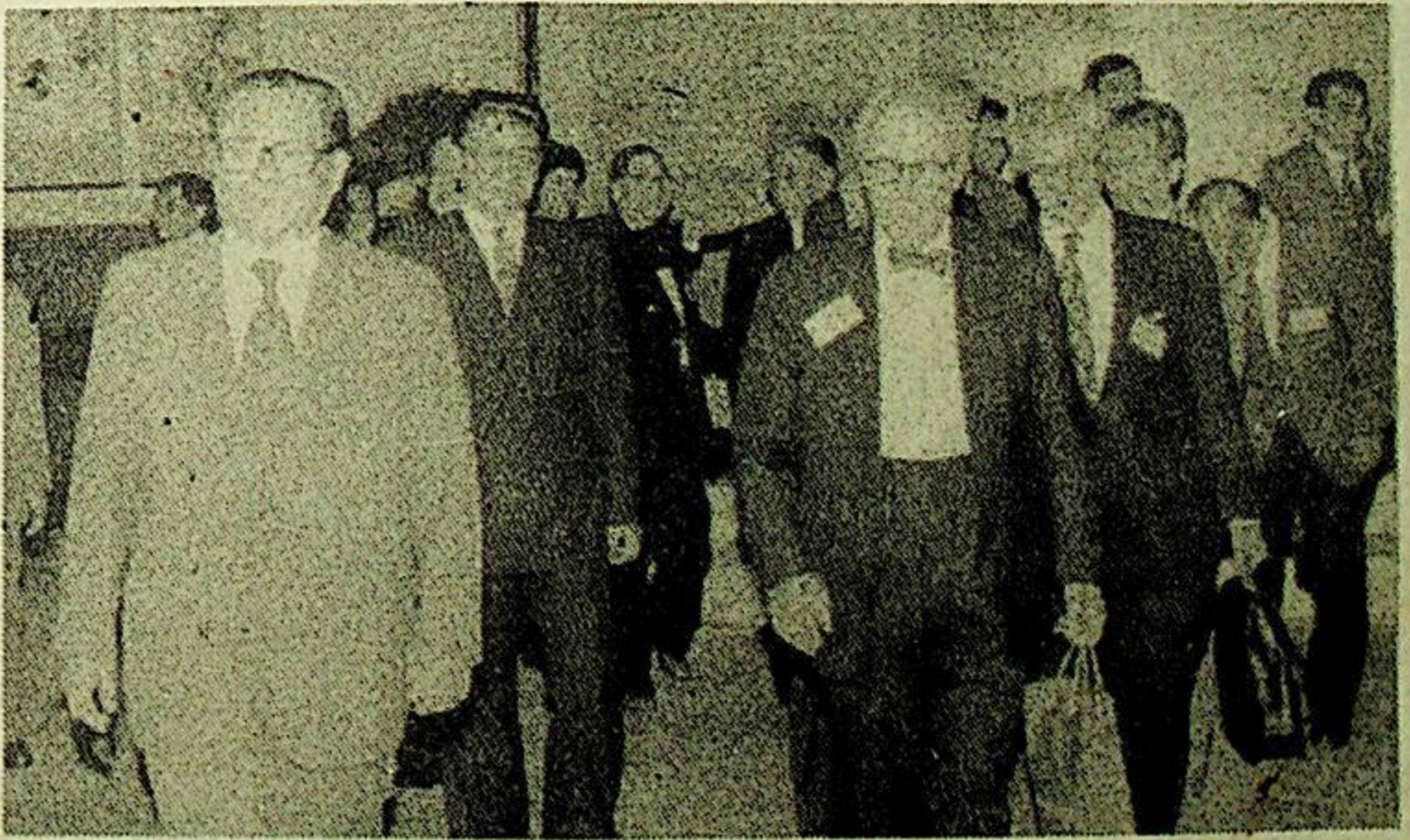
جياڭ زېمىن 9 - ئاينىڭ 18 - كۈنى «بازار ئىگىلىكى ۋە جۇڭگو» خەلقئارا مۇھاكىمە يىغىنىغا قاتنىشىۋاتقان چەت ئەللىك مۇتەخەسسسلەر ۋە ئالىملار بىلەن كۆرۈشتى. سۈرەتتە: ئوڭدىن 1 - كىشى نوبىل ئىقتىسادشۇناسلىق مۇكاپاتىغا ئېرىشكەن، دۇنيا بويىچە ئاتاقلىق ئىقتىسادشۇناس، پىنسلۋانىيە داشۆسىنىڭ پروفېسسورى كرايىن.

ئىقتىسادشۇناسلىق مۇكاپاتىغا ئېرىشكەن پروفېسسورى لاۋرېنس كرايىن مۇنداق دېدى: سوتسىيالىستىك بازار ئىگىلىكى بازار ئىگىلىكىنىڭ بىر خىل ئەندىزىسى، بەزى دۆلەتلەرنىڭ مەركەز پىلانلىق ئىگىلىكىدىن بازار ئىگىلىكىگە ئۆتۈشتە قوللانغان «تولغاق بىلەن داۋالاش» ئۇسۇلى ئۈنۈم بەرمىدى، ۋە ھالەنكى، جۇڭگو قوللانغان تەدرىجىي ئىلگىرىلەش ئۇسۇلى خېلى قانائەتلىنەرلىك نەتىجىلەرگە ئېرىشتى.