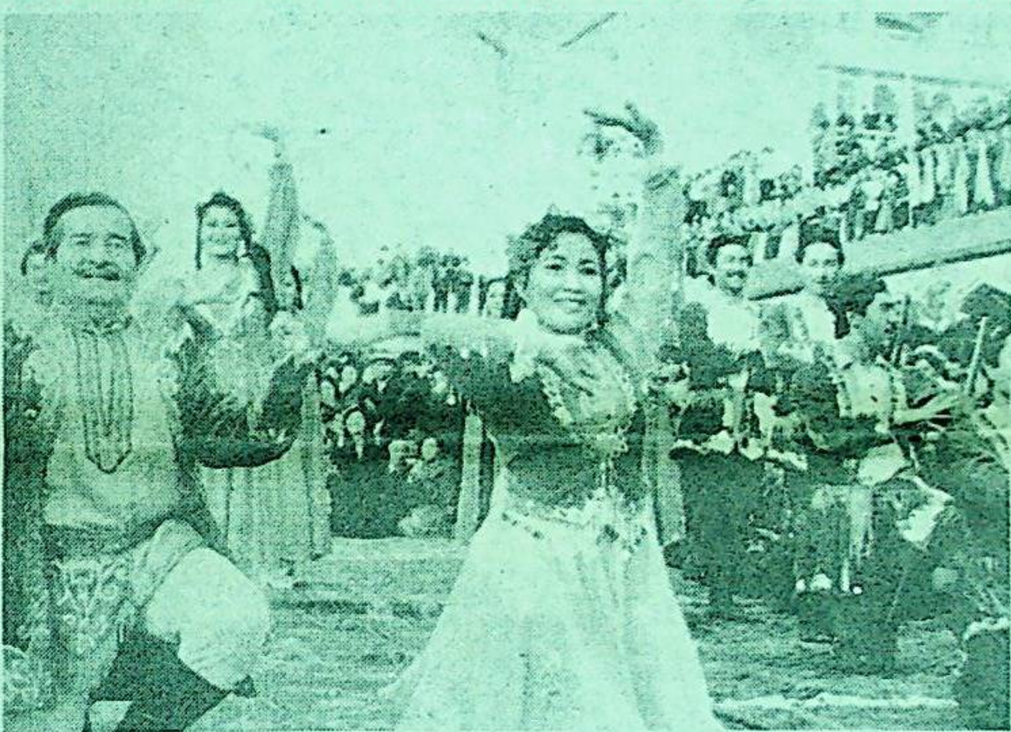
نورۇز ناۋاسى

ئەنە كۆڭلەم - باھار پەسلى كېلىپ ئاسمان - زېمىن كۈلدى، كۈلۈپ مايسا، كىياھ - ياپراق، تەبىئەت پەيزىگە چۆمدى، چىمەنلار تولۇپ كۆلگە، دىماقلىرىغا يۇراق چاچماق، ھايات ياشاپ، ئۆمۈر گۈلدەك گۈزەل مەنا بىلەن تولدى. كۆڭۈللەر شادىمان بولدى ۋىسال چاغلار يېتىپ كەلگەچ، باھارغا تەنتەنە ئەيلەپ تۈمەن بۇلبۇل ناۋا قىلدى. قىزىلگۈل ئىشقى بۇلبۇل گۈلستانىز ناۋا قىلسا، باھار ئەيسادا قۇشلار خۇشاللىق نەغمىلەر قىلدى.