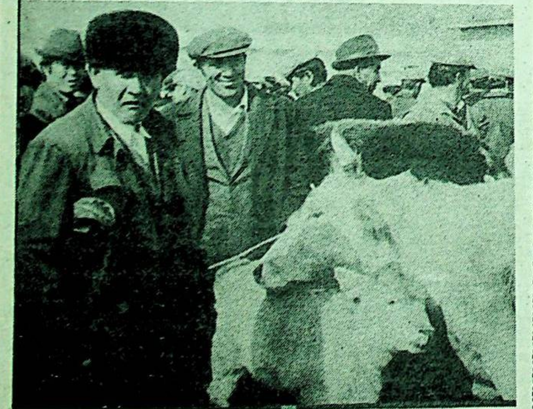
غۇلجا ناھىيە خۇدىيار يۈزى يېزىلىق پارتكوم ۋە خەلق ھۆكۈمىتى ئون مو يەر، 39 ھېكتار يۈەن مەبلەغ ئاجرىتىپ، شەنبىلىك چارۋا ماللار بازىرى ئاچتى. نەتىجىدە، دېھقان چارۋىچىلارنىڭ بازار ئىگىلىكى بىلەن شۇغۇللىنىشقا قولايلىق شارائىت يارىتىپ بېرىلدى. سۈرەتتە: بازاردىن بىر كۆرۈنۈش.