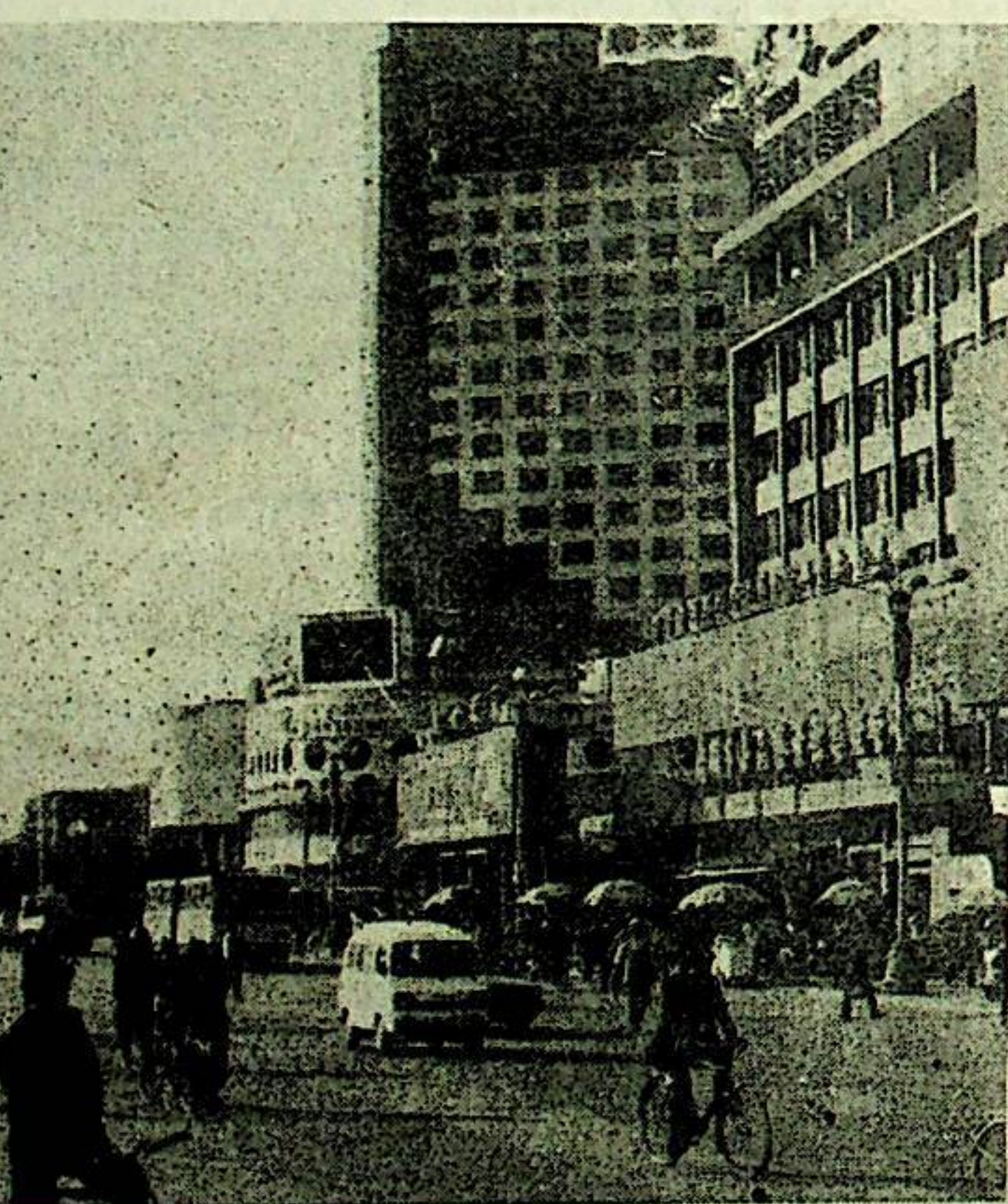
2. دۇنيا ئۇرۇشىدا ناتىسىستلار بولۇپ كەتكەن ئالتۇننىڭ ئىسرى تارىخىنىڭ سۇلالەسى

لەنجۇ 2000 يىللىق تارىخقا ئىگە قەدىمىي شەھەر بولۇپ، تارىختىن بۇيان، «يىپەك يولى» دىكى مەشھۇر شەھەر ۋە خېشى كارىدورىدىن شىنجاڭ، چىڭخەي ئارقىلىق ئاسىيا، ئافرىقا، ياۋروپادىن ئىبارەت ئۈچ قىتئە بىلەن دوستانە ئالاقە قىلىشنىكى مۇھىم قاتناش تۈگۈنى بولۇپ كەلدى. لەنجۇ شەھىرى ھازىر گەنسۇ ئۆلكىسىنىڭ مەركىزى. ئۇ، 1941 - يىلىدىن بېرى گەنسۇنىڭ سىياسىي، ئىقتىسادىي، پەن - تېخنىكا ۋە مەدەنىيەت مەركىزى بولۇپ كەلمەكتە. ئازادلىقتىن كېيىن دۆلەت بۇ شەھەردە نېفىت، پولات، خىمىيە، رەڭلىك مېتال، ماشىنسىزلىق، ئېلېكتر كۈچى ئاساس قىلىنغان سانائەت سىستېمىسى ۋە ئاتوم ئېنېرگىيىسى قاتارلىق ئالدىنقى قاتاردىكى پەن تەتقىقات بازىلىرىنى قۇرۇپ، ئۇنى غەربىي شىمالدىكى ئىككىنچى چوڭ شەھەرگە ئايلاندۇردى. 14 مىڭ كۋادرات كىلومېتىر زېمىنىغا ئىگە بۇ شەھەردە ھازىر 2 مىليون 300 مىڭدىن كۆپرەك ئاھالە بار. سۈرەتتە: بويىز ئىستانسىسى شەرقىي يولىدىن بىر كۆرۈنۈش. سېدىق قاۋۇز جەزىرى ۋە فونوسى