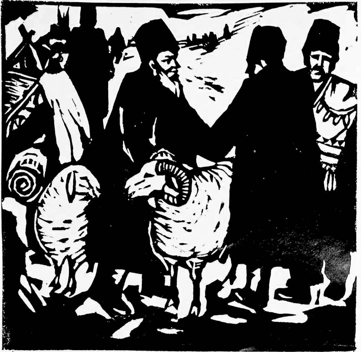
مال بازىرىدا ساۋ جىيەن بىن ئويمىسى