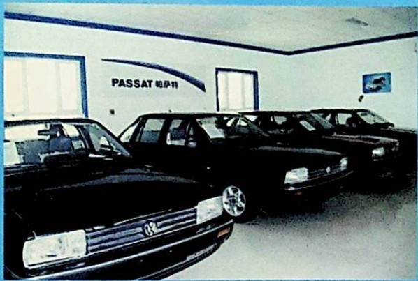
شىركەت كىرگۈزگەن «ساتانا» ماركىلىق ماشىنىلار