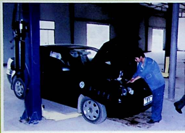
شىركەت قارىمىقىدىكى شاخىخى ھەممىباب ماشىنىلىرى رېمونت زاۋۇتى