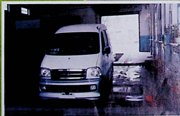
شىركەت قارىمىقىدىكى ھەر خىل تىپلىق ماشىنىلارنى قايتىۋاتقان تەكشۈرۈش پونكىتى