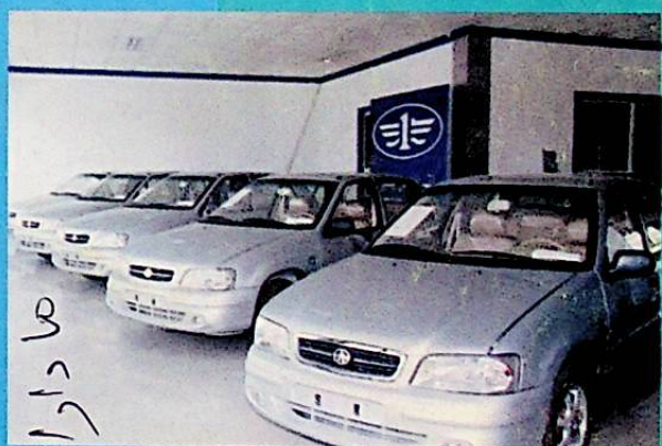
شىركەت كىرگۈزگەن «ئالى» ماركىلىق ماشىنىلار