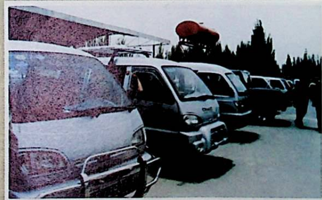
كونا ماشىنا بازىرىدىكى خېرىدار كۈتۈۋاتقان ماشىنىلار