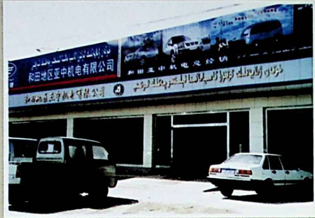
شىركەتنىڭ يورۇققاش دەرياسى بويىدىكى تىجارەت زالى