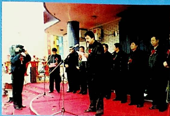
ۋىلايەت رەھبەرلىرى شىركەتنىڭ قۇرۇلۇش مۇراسىمىدا