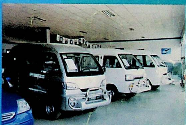
شىركەت كىرگۈزگەن «سۆڭ خۇا جىياڭ» ماركىلىق كىچىك تىپتىكى مېنىبوسلار