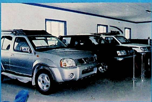
شىركەت كىرگۈزگەن ئالى تىپلىق ماشىنىلار