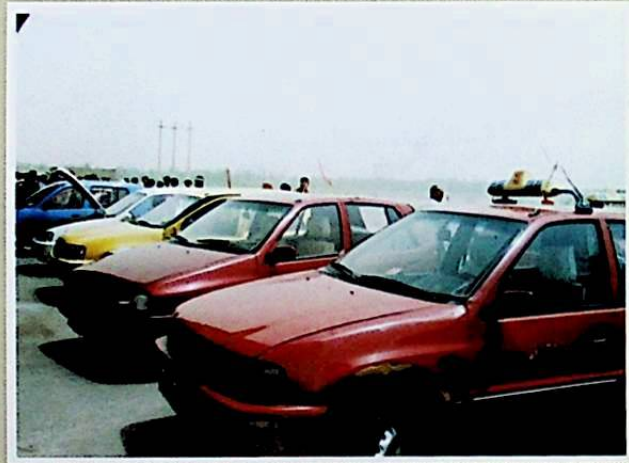
يورۇققاش دەرياسى بويىدىكى خوتەن ۋىلايەتلىك ئوتتۇرا ئاسىيا ماشىنا ئىلىكتر چەكلىك شىركىتىنىڭ كونا ماشىنا بازىرىدىكى خېرىدار كۈتۈۋاتقان ماشىنىلار