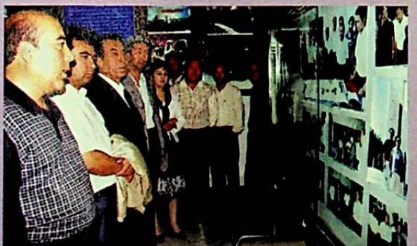
يىغىن قاتناشچىلىرى خوتەن ناھىيىسىنىڭ ئىچملىك سۇ ئۆزگەرتىش خاتىرە سارىيىدا.