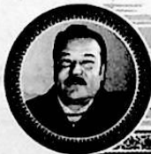
ئالىمجان سادىق نامىدىكى

سۇ ئامبىرى يار ئېلىپ كەتتى. نەچچە مىڭ مو زىرائەت، نەچچە يۈز دېھقاننىڭ ئۆيى سۇ ئاستىدا قالدى. رەھبەرلەر بۇنىڭغا يۈكسەك دەرىجىدە ئەھمىيەت بېرىپ، شۇ ھامان ئاپەت يۈز بەرگەن جايغا كېلىپ، ئۆلگەن ئا - دەم، چارۋىلارنى سۈزۈشكە، يوقاپ كەتكەنلەرنى ئىز -