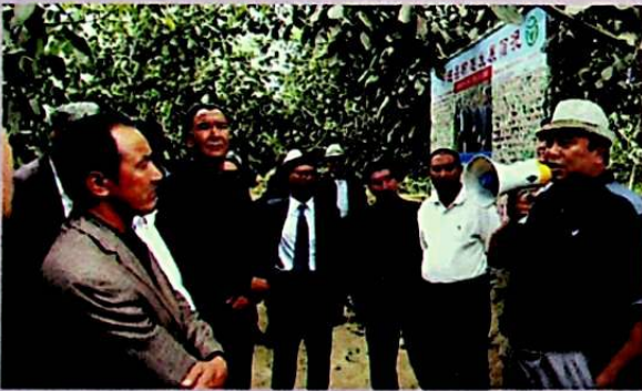
يىغىن قاتناشچىلىرى خوتەن ناھىيە لايىقا يېزىسىنىڭ ياڭاچىملىق بازىسىنى كۆزدىن كەچۈردى.