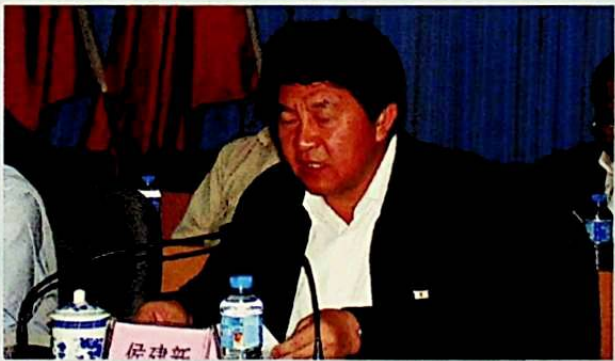
خوتەن ناھىيىلىك پارتكومنىڭ شۇجىسى يولداش خوجىنەن يىغىننىڭ خوتەن ناھىيىسىدە چاقىرىلغانلىقىنى تەبرىكلەپ سۆز قىلدى.

يىغىندا باش شۇجى خۇجىستاننىڭ مەملىكەتلىك ئەدەبىيات - سەنئەتچىلەر بىرلەشمىسىنىڭ 8 - قۇرۇلتىيى ۋە جۇڭگو يازغۇچىلار جەمئىيىتىنىڭ 7 - قۇرۇلتىيىدا قىلغان مۇھىم سۆزى، ئاپتونوم رايون ۋە ۋىلايىتىمىزنىڭ ئالاقىدار ھۆججەتلىرى ئۆگىنىلدى. يىغىن قاتناشچىلىرى ۋىلايىتىمىزنىڭ ئىقتىسادى ئۇچقاندەك تەرەققىي قىلىۋاتقان تارىخىي شارائىتىدا، ئەدەبىي ئىجادىيەتكە نېمىنى يېزىش ۋە قانداق يېزىش مەسلىسىنى چۆرىدىگەن ھالدا مۇھاكىمە ئېلىپ باردى. ۋىلايىتىمىزنىڭ يېزا ئىگىلىكى، مائىلە رىپ، سەھىيە - دورىگەرلىك، يىغى يېزا قۇرۇلۇشى جەھەتتە قولغا كەلتۈرۈلگەن نەتىجىلەرنى ئېكە كۆرسىتىپ قىلىپ مول ئىجادىيەت ماتېرىيالغا ئېرىشتى.