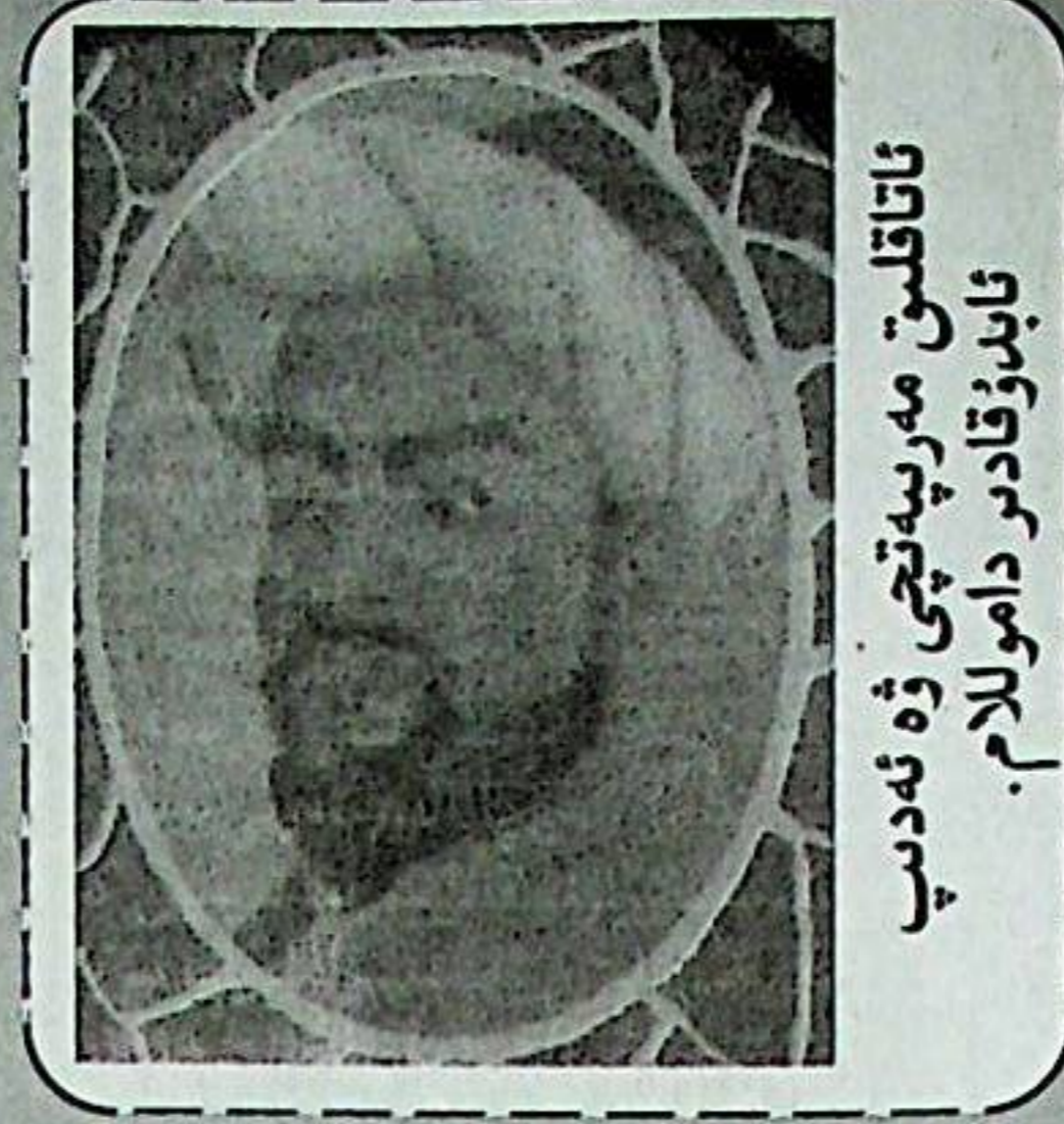
ئاتا قىلىم مۇسسا سايرامى، ئابدۇقادىر داموللام.