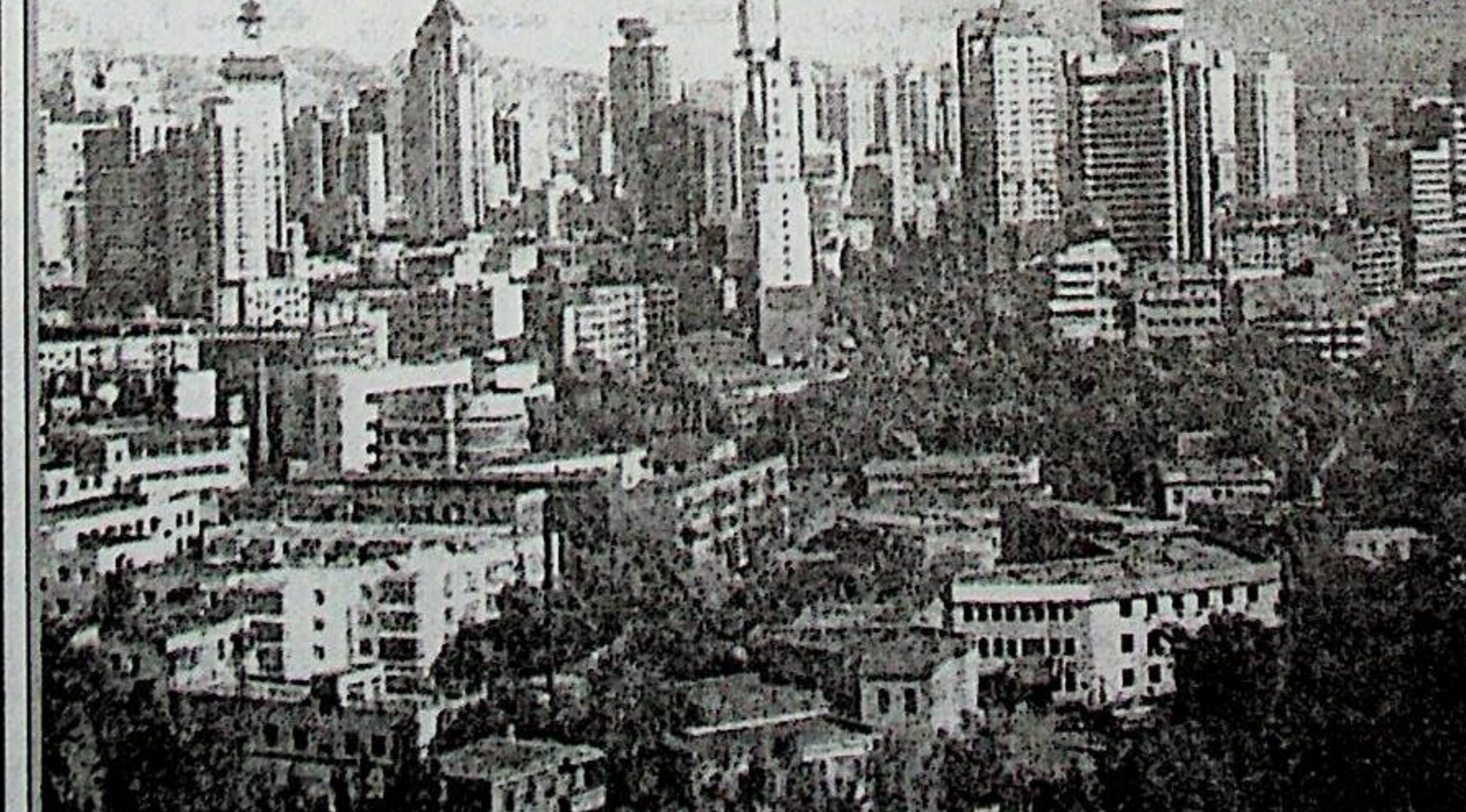
ش ئۇ نار پايەختى ئۇرۇمچىنىڭ كۆرۈنۈشى.

لوقمان ھاكىم سەيبىيە تېۋىپلىق قىلىپ تۇرۇپ، تۇرپانغا كېلىپ قاپتۇ. تۇرپاننىڭ ھەممىلا يېرىدە دې - كىدەك چامغۇرنىڭ بارلىقىنى كۆرۈپ، «بۇ يۇرتنىڭ ئادەملىرى كېسەل بولمىغۇدەك، چۈنكى بۇ جايدا چام -