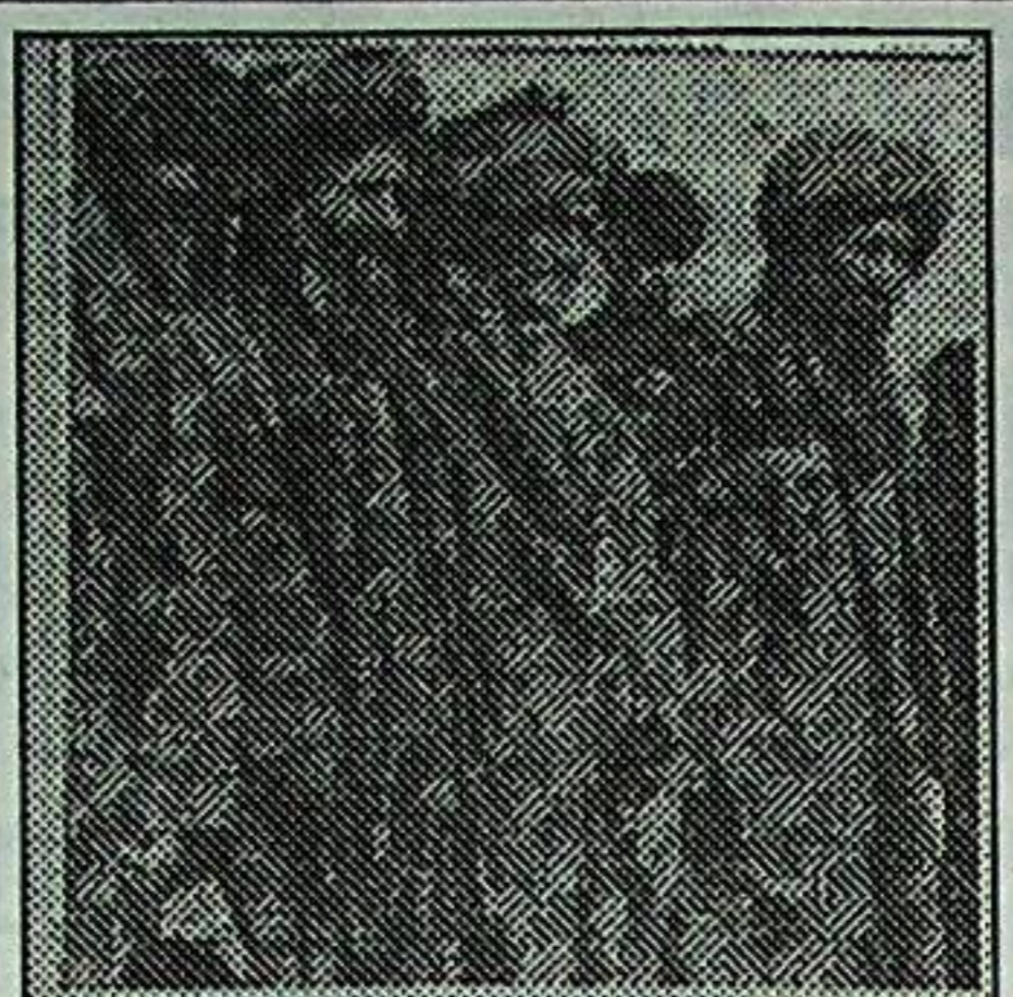
مۇزاكىرىلەر ئوتتۇرىسىدا مۇزاكىرىلەر جەريانىدا قانداقتۇر ئىجابىي ئۆزگىرىشلەر بارمۇ؟

ئەزىزۇللا: تالىپلار ئۆزلىرىنىڭ جىنايىتى ھەرىكەتلىرىنى ئەمەلگە ئاشۇرۇپ، قۇرئانغا ئىشارە قىلىدۇ.