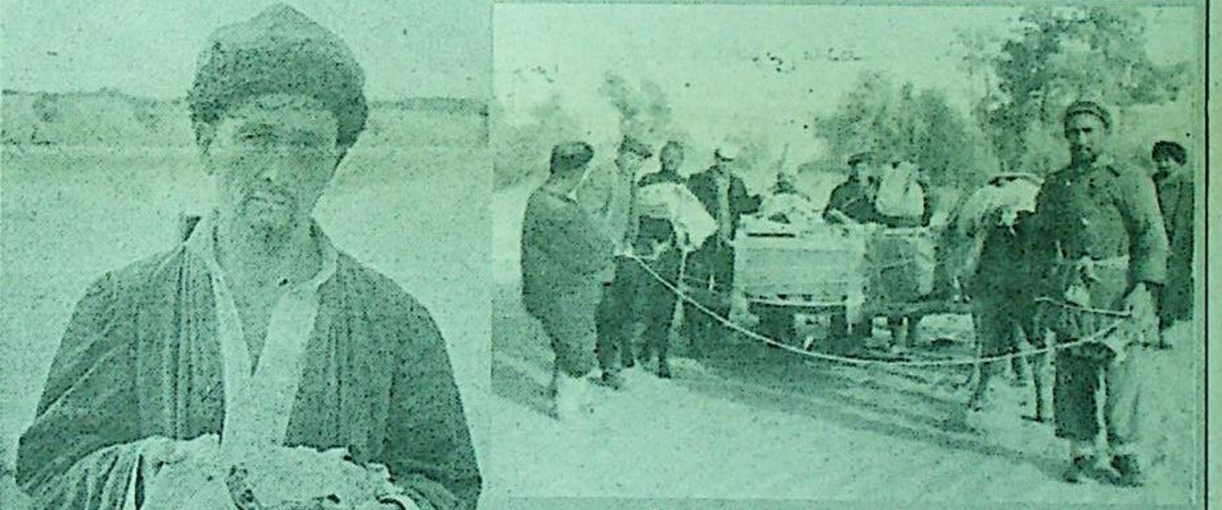
سۈرەتتە: 1959 - ۋىلى ئۆكتەبىردە نىيە پوتەي خارابىسىدىن تېپىلغان ئادەم جەسىدىنى قۇملۇقتىن ئېلىپ چىقىۋاتقان پەيت.