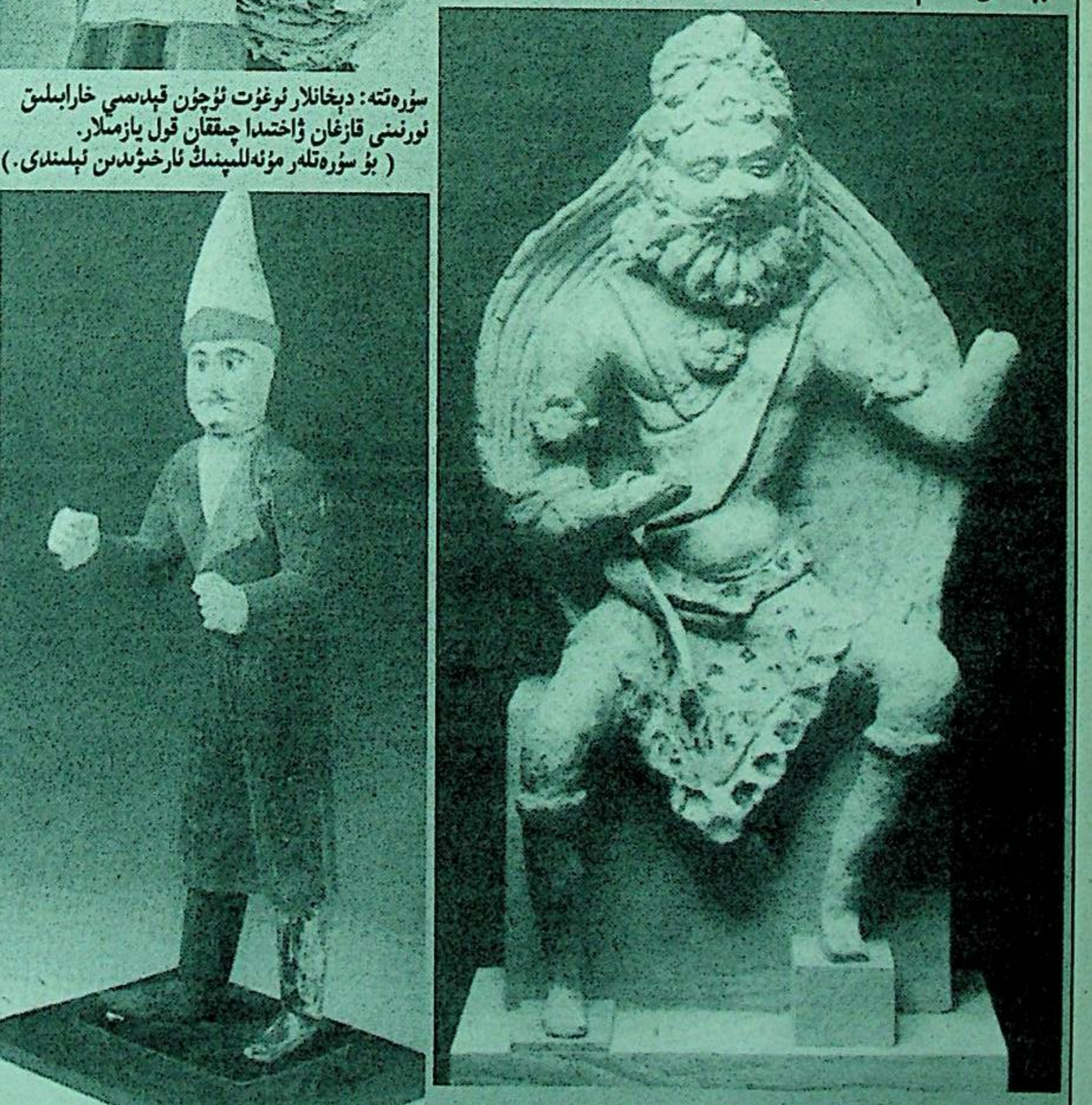
سۈرەتلەردە: ئىسلامىيەتتىن ئىلگىرىكى ئۇيغۇر ھەيكەلتاراشلىق نەمۇنلىرى، «ئىپەك يولى» كىتابىدىن، بېرلىن، دىتريش رايونى نەشرىياتى ۋە «شىنجاڭ ئۇيغۇر ئاۋتونوم رايونلۇق مۇزېي» كىتابىدىن. ( جۇڭگو مەدەنىيەت يادىكارلىقلىرى نەشرىياتى ).