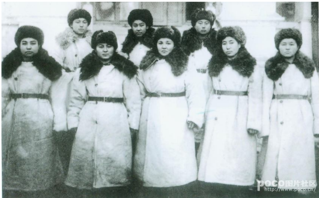
- مەنبە: (ئازادلىق جەڭچىسى رىزۋانگۈل) ناملىق كىتاپتىن ئېلىندى

زىننەت ئەخمەت ئىلى ۋىلايىتىدە تۇغۇلغان بولۇپ، ئەينى چاغدىكى جېلىيۇزى ناھىيەسىنىڭ كېپەكئۆزى يېزىسىدىن. ئۇمۇ سەككىز ھەمىشە قىز كەبى ئۈچ ۋىلايەت ئىنقىلابىغا قاتنىشىپ شەپقەت ھەمىشەسى بولغان. كېيىن ئالمۇتاغا چىقىپ كەتكەن. مىللى باراۋەرلىك، مىللى ئازادلىق ئۈچۈن جەڭگاھتا ئەرلەرگە ئوخشاش قان كېچىپ جەڭ قىلغان بۇ سەككىز نەپەر ۋىزىدان-غۇرۇلۇق قىزلارخەلقىمىز قەلبىدىن مەڭگۈ ئۆچمەيدۇ، مىللى ئارمىيىدىكى مېڭىلغان قەھرىمان قىز-ئوغۇللار ئەۋلادىتىن ئەۋلادقا يادلىنىدۇ. بىز كېيىنكى ئەۋلادلارغا بۇقەھرىمانلارنىڭ باتۇرلۇقىنى ئىش-ئىزلىرىنى مىراس قالدۇرۇش قەرزىمىز بار ئەلۋەتتە.