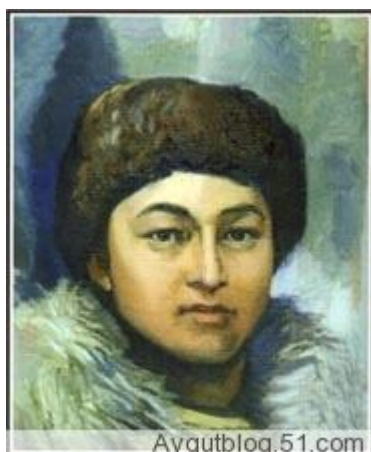
بۇ رىزۋانگۈلنىڭ قازاقىستانلىق ئۇيغۇر رەسسام رۇسلان يۈسۈپ سىزغان رەسىمى

ئۇنىڭ ئۆلۈمى كىشىنى بەكمۇ ئېچىندۇرىدۇ . ئۇنىڭ نامى ۋەتەن ، مىللەت ئۈچۈن قان تۆككەن مىڭلىغان ئوت يۈرەك ئوغۇل - قىزلىرىمىز قاتارىدا تارىخ بېتىگە مەڭگۈلۈك يېزىلدى .