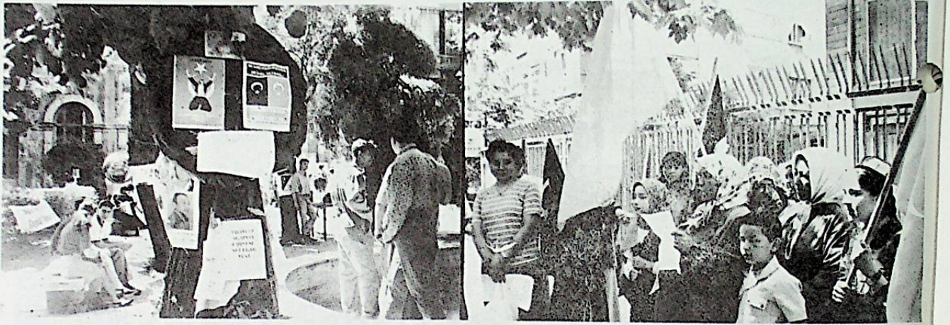
ب د ت خابىنات رايونى مەركىزى باغچىسىدا