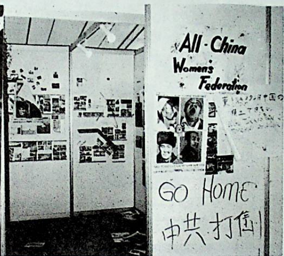
ب د ت داشەرقى توركىستان كۆرگە زمىسى