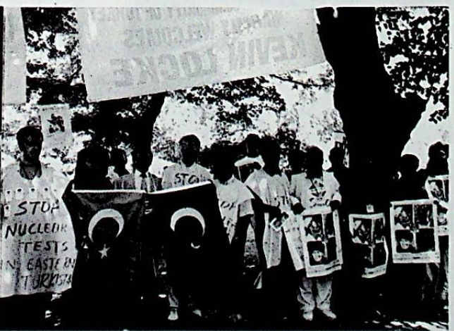
خىتاي ھۆكۈمىتىنىڭ ئاتوم يادرو سىنىغىغا قارشى نارازىلىق