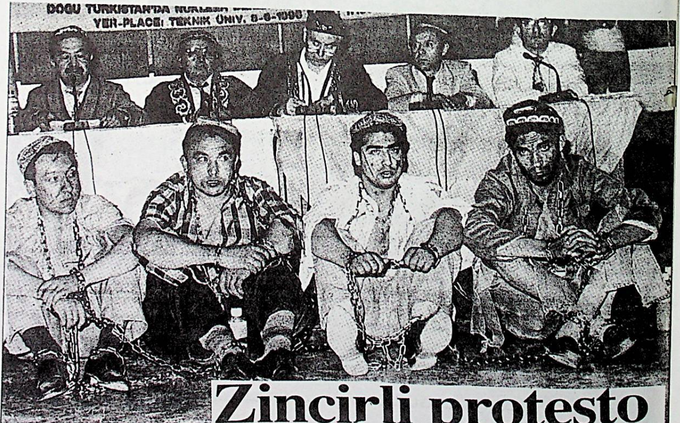
خىتاي كونسولخانىسى ئالدىدا