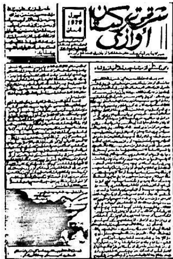
گۈزۈشتىن بىر سەھىپە