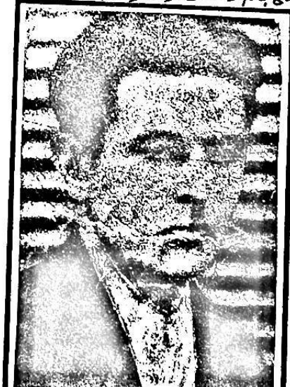
ھەمىدى ئەپەندى، 1896-يىلى قەشقەردە ئوغۇلغان، 1938-يىلى شىنجاڭ ئۆزىگە باشلىق قىلىنغان، مائارىپ، 1936-يىلى شىنجاڭ ئۆزىگە ئولتۇرغان.