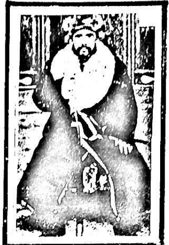
مۇھاممەد نىياز مۇھاممەد، 1884-يىلى قۇمۇلدا ئوغۇلغان، 1931-يىلى شىنجاڭ ئۆزىگە باشلىق قىلىنغان، 1941-يىلى شىنجاڭ ئۆزىگە ئولتۇرغان.