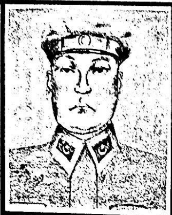
شەرىپخان، 1890-يىلى ئالتايلىق ئوغۇلغان. 1933-يىلى ئالتايلىق ئوغۇلغا باشلىق قىلغان، 1942-يىلى شىنجاڭ ئۆزىگە ئولتۇرۇلغان.