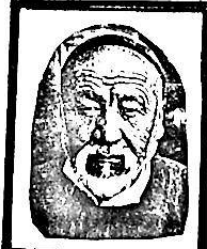
شىمىنكام تارىخ، 1884-يىلى ئىلىدا ئوغۇلغان، تارىخىي، 1964-يىلى مائارىپ جالادىلىرى خاھىشقا باشلىق قىلىنغان.