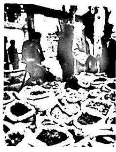
دورا - دارمانلار