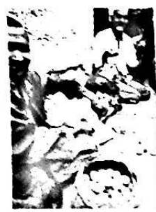
بىدەك - ئىچمەكلەر